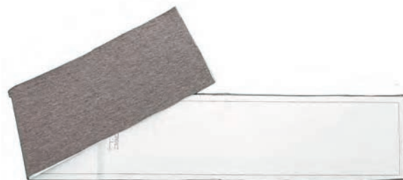
▲ ściągacz dołu