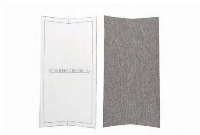
▲ ściągacze do rękawów