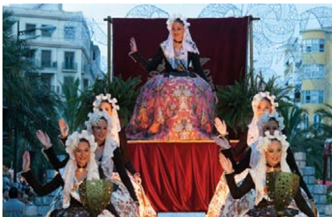
▲ Królowa obchodów Bellea de Foc