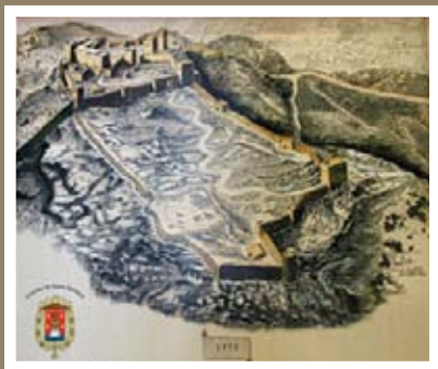
▲ Zamek w XVI w.