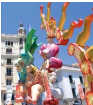
▲ Kolorowe Ninots przed Casa Carbonell

Mieszkańcy Alicante od niepamiętnych czasów witali nadejście lata, organizując pikniki na plaży, paląc ogniska, tańcząc wokół ognia i kąpiąc się w morzu. Ta tradycja nabrała kształtu oficjalnego święta w 1928 r. pod nazwą Ognisk św. Jana . Fiesta trwająca od 20 do 29 czerwca ma związek z prastarym kultem ognia, który miał oczyszczać i odganiać złe moce. Przygotowania do święta zaczynają się już w maju wyborem królowej obchodów Bellea de Foc w wersji dorosłej i dziecięcej, które – ubrane w tradycyjne ludowe stroje i koronkę na głowie – przewodniczą parodom (kandydatki zgłaszają poszczególne dzielnice). Punktem kulminacyjnym imprezy jest Noc Świętojańska, zwana la Nit del Foc (nocą ognia) z 23 na 24 czerwca. Najpierw odbywa się pochód Ninots – wielkich kolorowych rzeźb – pomników i postaci z kartonu lub drewna przedstawianych w sposób satyryczny, a wykonywanych specjalnie na festę. O północy następuje ich uroczyste podpalenie. Świętu towarzyszą przeróżne imprezy kulturalne, pokazy ogni sztucznych, zabawy taneczne, średniowieczny jarmark, a także degustacje tradycyjnych potraw, zwłaszcza coca de Sant Joan (kruchego ciasta z warzywami nadziewanego tuńczykiem i cebulą).