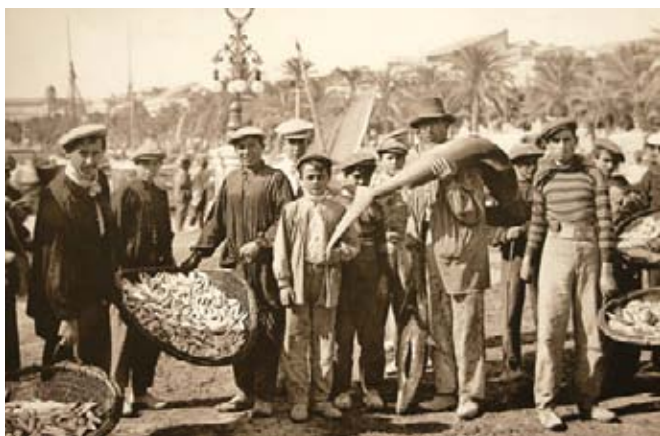
▲ Port na archiwalnej fotografii, źródło: Wystawa Museo de Alicante

Na nabrzeżu obok mariny można zwiedzić Museo de la Volvo Ocean Race – muzeum słynnych regat dookoła Ziemi, które odbywają się co trzy lata. Alicante już trzy razy było miejscem startu tych prestiżowych zawodów żeglarskich 📍 Muelle de Levante, Puerto de Alicante , tel. +34 965 138 080, www.volvo-oceanrace.com , czynne latem (do 12 X): wt.–sb. 11.00–21.00, nd. i św. 11.00–15.00, zimą wt.–czw. 10.00–14.00, pt.–sb. 10.00–18.00, nd. i św. 10.00–14.00.