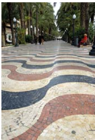
▲ Explanada de España

Centrum miasta rozłożone jest pomiędzy portem a dwoma wzgórzami – Benacantil (166 m n.p.m.), na którym wznosi się zamek ★ Castillo de Santa Bárbara (zob. s. 68), oraz od północy Monte Tossal