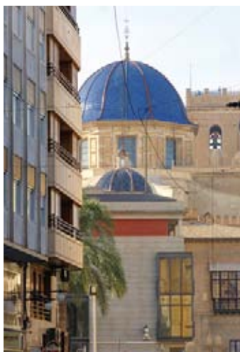
▲ Szafirowe kopuły bazyliki św. Marii

dawnego meczetu (najpierw był tu kościół gotycki pw. św. Marii). Stanowi przepiękny przykład hiszpańskiego baroku. Została wzniesiona między 1672 a 1784 r. z udziałem wielu projektantów, wśród których był także znany barokowy architekt Jaime Bort y Meliá (autor m.in. głównej fasady katedry w Murcji). W bazylice znajdziemy także inne style architektoniczne – od elementów gotyckich, przez rokoko po neoklasyczne (we wnętrzu). Najbardziej reprezentatywna jest bogato rzeźbiona barokowa fasada Wniebowzięcia i Koronacji Matki Bożej z 1682 r. autorstwa Nicolása de Bussy urodzonego w Strasburgu, ale uznawanego za hiszpańskiego rzeźbiarza epoki baroku (tworzył także w Murcji i Orihueli). Warto wspiąć się na wieżę – dzwonicę Torre Basilica de Santa María , by po pokonaniu 170 schodów podziwiać panoramę miasta i sady palmowe z lotu ptaka. i www.campanariomiradorelche.com , czynne: codz. 10.30–15.00, VII–IX 11.00–19.00, wstęp 2 EUR, ulgowy 1 EUR, dzieci do 5 lat gratis. W bazylice można