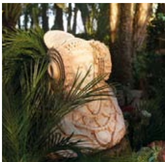
▲ Figura w parku inspirowana Damą z Elche

Zona archeologiczna z ruinami i Muzeum Monograficznym przybliżają historię miasta od neolitu po czasy Wizygotów. Wśród wydobytych przez archeologów fragmentów zabudowy miasta zobaczymy mury rzymskie, termy wschodnie i zachodnie, domy Iberów i Rzymian, świątynię Iberów, bazylikę wczesnochrześcijańską oraz miejsce, gdzie odkryto Damę z Elche. Miał ją znaleźć podczas prac na polu 14-letni chłopiec. Rzeźbę kupił francuski archeolog Pierre Paris i do 1941 r. gościła w Luvrze. Rząd Franco odkupił ją od Francji w zamian za dzieła Velázquez i El Greco. Dzisiaj jest wystawiona w Narodowym Muzeum Archeologicznym w Madrycie. Rzeźba wyobraża kobietę – najpewniej bogatą przedstawicielkę ówczesnej arystokracji, kapłankę, a może boginię – z bardzo ozdobnym przybraniem głowy. Popiersie wysokości 56 cm zostało wykonane z wapienia; pierwotnie było polichromowane. Z tyłu ma głęboki otwór średnicy 18 cm – mógł służyć jako urna albo schowek na relikwie; do dzisiaj pozostaje to tajemnicą. i c. de Dolors km 1,7, na południe od centrum Elche, tel. +34 966 611 506, www.laalcudia.ua.es , czynne: wt.–sb. 10.00–20.00, X–III godziny mogą się zmieniać, nd. i św. 10.00–15.00, Muzeum Monograficzne czynne: wt.–sb. 10.00–15.00, nd. i św. jw., wstęp 5 EUR, bilet ulgowy 2 EUR, dzieci poniżej 6 lat gratis.