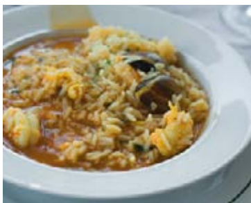
▲ Caldoso – są różne sposoby przyrządzania tej regionalnej potrawy