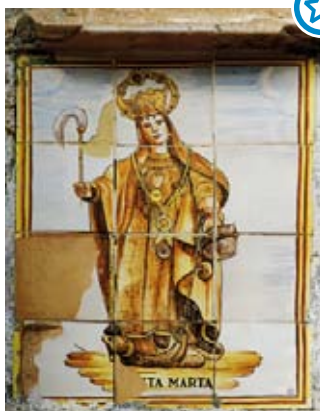
▲ Wizerunek św. Marty na azulejos

O wstawiennictwo św. Marty prosili mieszkańcy w trudnych momentach historycznych. 29 lipca 1538 r. miała ukazać się i ocalić miasto przed piratami. 8 maja 1653 r. na jej wizerunku pojawiły się cudowne łzy. Święta płakała przez dwie godziny, w tym samym czasie, kiedy król Filip IV podpisywał zgodę na budowę zbiornika wodnego do irygacji pól otaczających miasto. Te udogodnienia pozwoliły mieszkańcom przetrwać ciężkie czasy suszy i głodu w XVII w., a miasteczko rozwinęło się gospodarczo i zwiększyło znacznie swoją populację. Na pamiątkę tego wydarzenia 8 maja obchodzone jest święto Lágrimas de Santa Marta (Łzy św. Marty). Niesamowite jest to, że data 8 maja pojawia się w historii także w roku 1300, kiedy Bernardo de Sarriá zakłada miasto... Ku czci św. Marty, od ponad 250 lat, odbywają się także Fiestas de Moros y Cristianos (24–31 lipca) z inscenizacjami historycznymi przy głównej plaży, do której o świcie 28 lipca przybijają statki piratów berberyjskich (ta część przedstawienia nazywa się desembarco ).