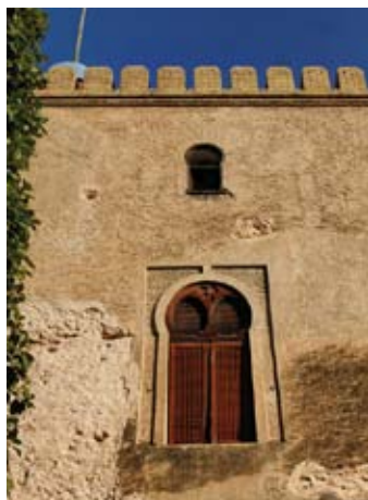
▲ Neoarabskie okna wieży La Calahorra

Z zabytków mauryjskich przetrwały oryginalne Łaźnie Arabskie – ★ Baños Arabes z 1150 r. – najlepiej zachowany tego typu zabytek w prowincji Walencja. Znajdują się w podziemiach dawnego