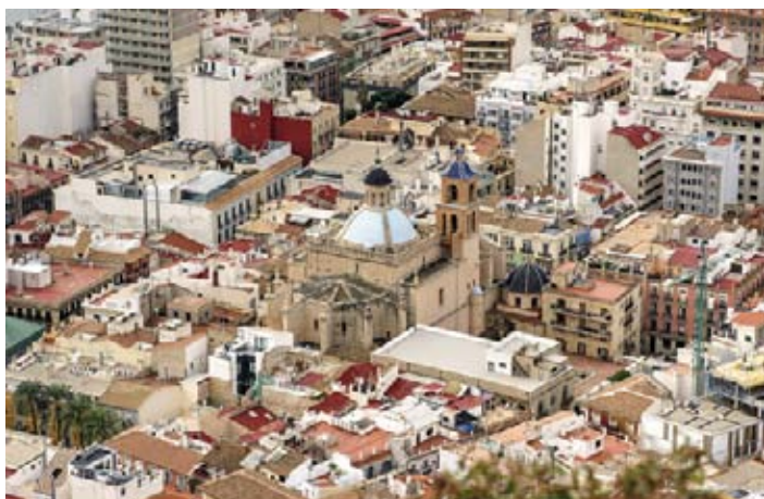
▲ Panorama starówki Alicante

Pierwsze ślady osadnictwa, odnalezione w okolicach Serra Grossa, pochodzą jeszcze z epoki brązu – drugiego tysiąclecia p.n.e. Zachowało się wiele pozostałości po osadach Iberów, którzy zasiedlali region od IV w p.n.e. Od III w p.n.e. zatokę kolonizowali Fenicjanie i Grecy, którzy nazywali powstałą tu osadę handlową – Acra Leuke – „białą twierdzą”. Hamilcar