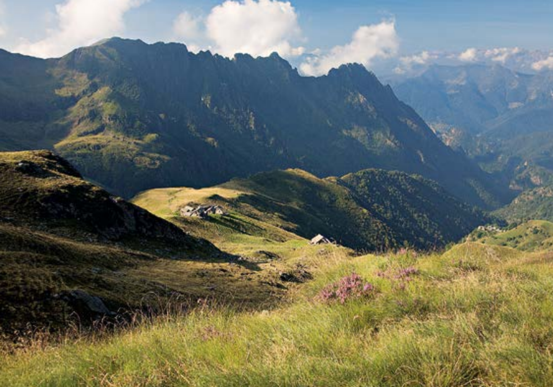
▲ Na hali Alpe Pianello, nieco poniżej przełęczy Bocchetta di Campello, można kupić ser.

stromo ku potokowi. Po przejściu na jego drugi brzeg przekraczamy na podejściu Roncaccio inferiore. Przy kościele, najwyżej położonym budynku przysiółka, pniemy się dalej do Roncaccio superiore. W lesie będziemy mieli sporadycznie okazję do podziwiania atrakcyjnych widoków na przysiółki gminy Rimella. Powyżej Roncaccio superiore trawersujemy zalesione,