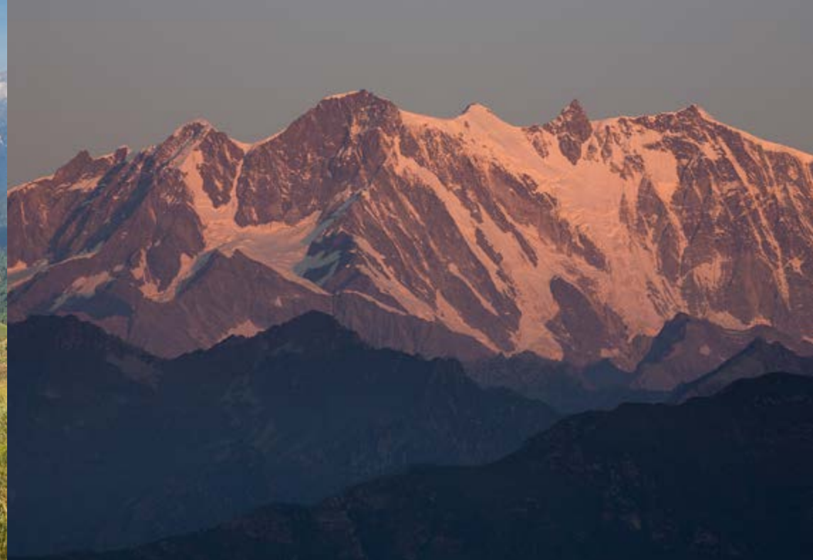
▲ Widok masywu Monte Rosa w pierwszych promieniach słońca z przełęczy Bocchetta di Campello.

zarosła, nie prowadzi już przez Ronco, lecz przez przysiółki Belvedere i Boco superiore. Przy kościele decydujemy się zatem na ścieżkę w lewo w dół, po czym przed osadą Belvedere odbijamy w prawo do kaplicy św. Antoniego. Dalej w lewo przez las do parkingu powyżej przysiółka Boco superiore. Tu wybieramy dolną spośród dwóch biegnących w prawo dróg,