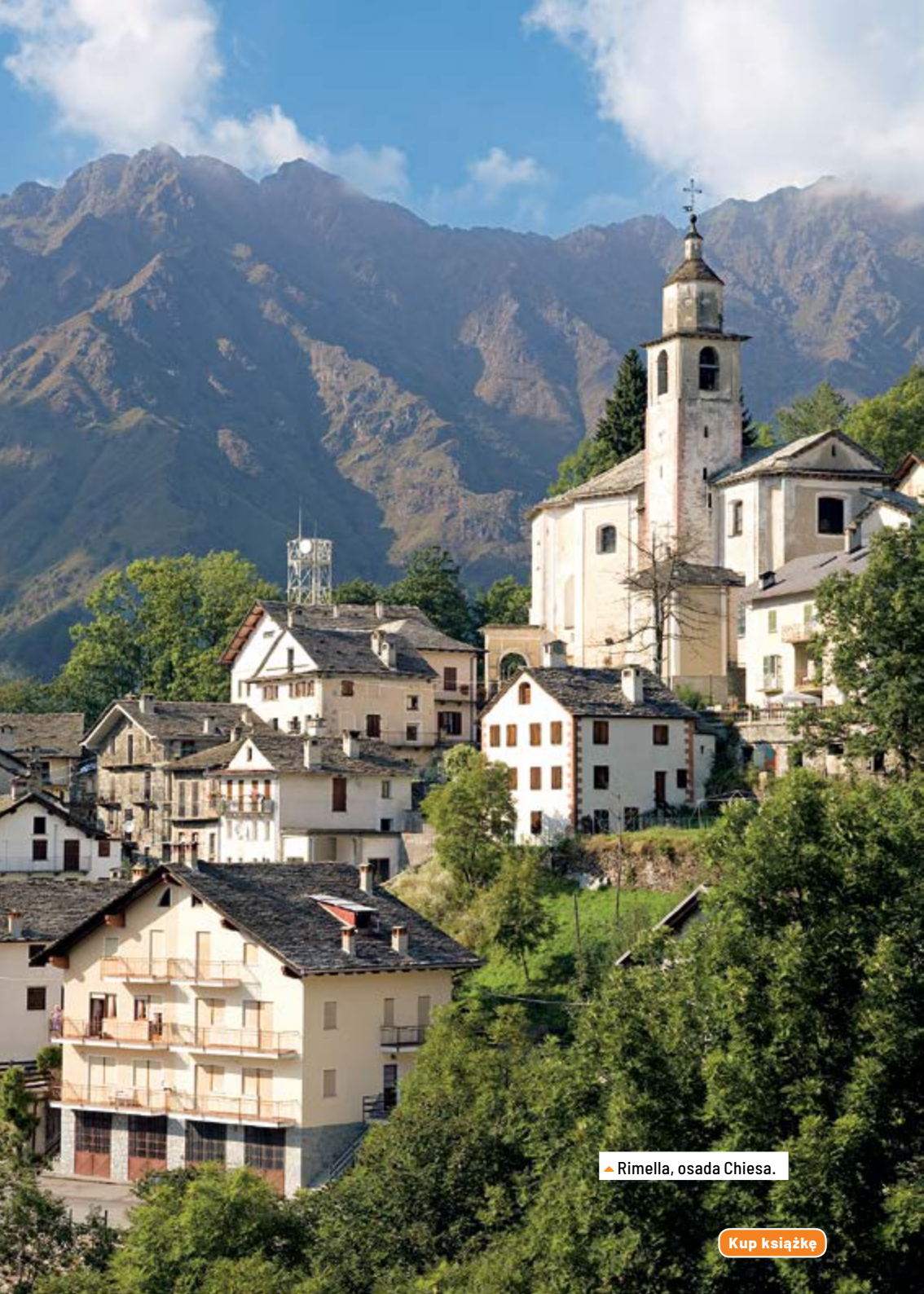
▲ Rimella, osada Chiesa.