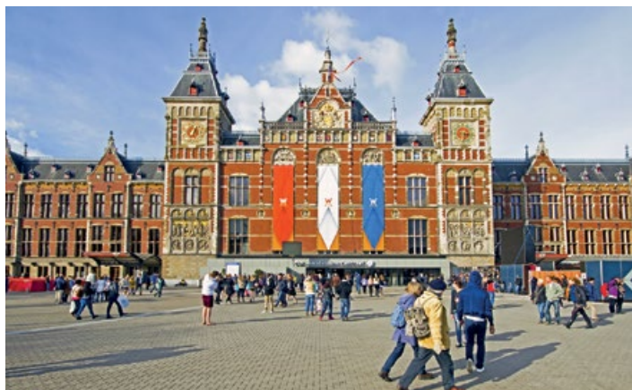
▲ Imponujący Amsterdam Centraal