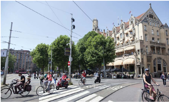
▲ American Hotel na Leidseplein

sklep pn.–sb.; bilety: 8 EUR, ulg. 4 EUR. Podobnie jak wiele tutejszych muzeów, Amsterdamskie Muzeum Fajek zaczęło swoją historię jako prywatna kolekcja pewnego zapalacza, który nazywał się Don Duco. Z kilku fajek odkrytych w czasie remontowania domu zbiory rozrosły się i obecnie liczą ok. 29,5 tys. egzemplarzy różnych kształtów, kolorów, zdobień i z różnych okresów historycznych. Zobaczyć tu można m.in. najstarsze znane na świecie fajki znalezione w Laosie liczące 4 tys. lat, a także najdłuższą fajkę, mierzącą 7,5 m. Zwiedzać można w towarzystwie kolekcjonera (w cenie biletu), który w przejrzysty sposób przybliży historię i sposób używania fajek oraz odpowie na pytania ciekawskich. Przy muzeum działa też specjalistyczny sklep, gdzie spośród setek fajek można wybrać coś dla siebie lub kupić najlepszy tytoń.