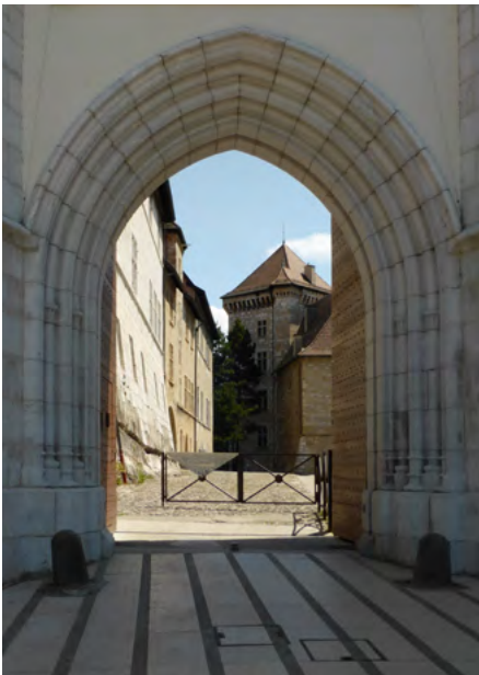
Brama na dziedzińcu

Wieża Królowej, usytuowana przy bramie wjazdowej (fot. powyżej), została zbudowana na planie kwadratu o boku 16 m. Ściany mają ponad 4 m grubości. Jej wysokość wynosi ok. 38 m.