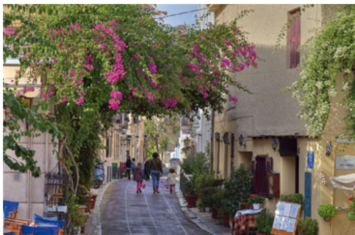
▲ Uliczka w dzielnicy Plaka

Rola Aten zaczęła powoli maleć wraz z nastaniem epoki bizantyjskiej. Filozofia neoplatonicka została zastąpiona