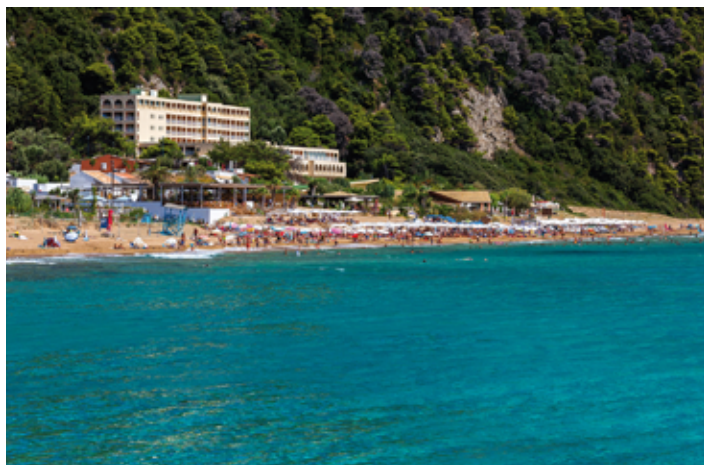
▲ Plaża w Glifadzie

Przyjeżdżając na Wybrzeże Apollina, warto również odwiedzić miejscowość VOULIAGMENI . Jej nazwa pochodzi od greckiego słowa oznaczającego „podwodny” lub „zatopiony”. Oprócz pięknej plaży znajduje się tu jezioro , które