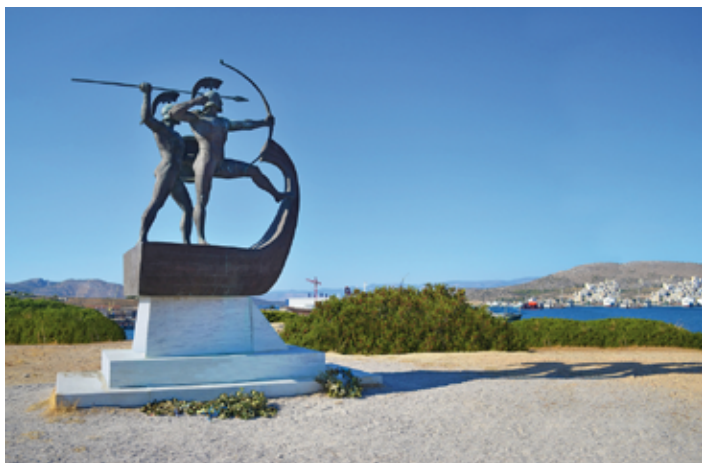
▲ Pomnik obrońców Salamin

Bujne zielone lasy, urokliwe wioski, dziewicze plaże oblane krystalicznie czystymi wodami – Egina może poszczycić się różnicowanym i pięknym krajobrazem.