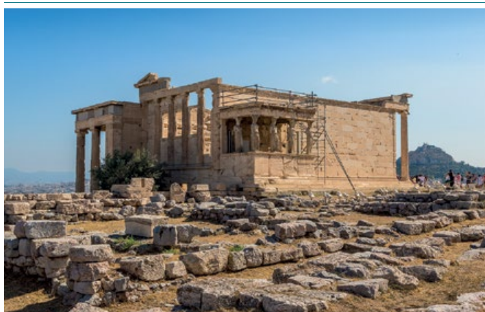
Erechtejon z widocznym portykiem Kariatyd

można podziwiać w Muzeum Akropolu, a szósta znajduje się w zbiorach londyńskiego British Museum). Warto zwrócić uwagę na nonszalancką elegancję, której przejawem są równoległe plisy tunik przywodzące na myśl żłobienia kolumn zastąpionych kariatydami. Po prawej stronie widać sześć kolumn w porządku jońskim tworzących wschodni portyk prowadzący do sanktuarium, w którym umieszczony był najstarszy na terenie zespołu świątynnego posąg Ateny, wykonany z drewna oliwnego. Zachodnia fasada została przebudowana w czasach Rzymian. Na sąsiednim dziedzińcu rośnie drzewo oliwne zasadzone w miejscu, w którym oddawano cześć świętemu drzewu Ateny (co wyjaśnia brak zadarszenia). W tej części Akropolu zachowały się nieliczne ślady mykeńskich zabudowań (1400–1125 p.n.e.). Od wschodu można zobaczyć fragmenty sanktuarium poświęconego Zeusowi. Później Rzymianie wzniesli obok tej budowli świątynię na planie koła poświęconą Romie i Augustowi – można ją rozpoznać po kilku kolumnach postawionych do pionu i rosnącym obok cyprysie. Z północno-zachodniego krańca wzgórza rozciąga się wspaniała panorama ★★ na dachy domów w dzielnicy Plaka. W każdy niedzielny poranek ewzoni ściągnąją (6.00) i wciągają (9.00) na maszt grecką flagę. Warto obejrzeć się i nacieszyć oczy