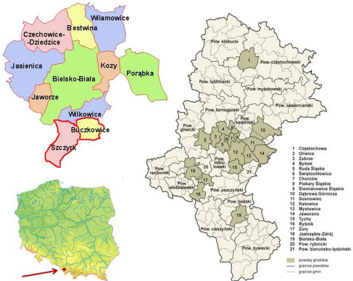
Ryc. 1: Gmina Buczkowice i miasto Szczyrk na tle podziału administracyjnego.