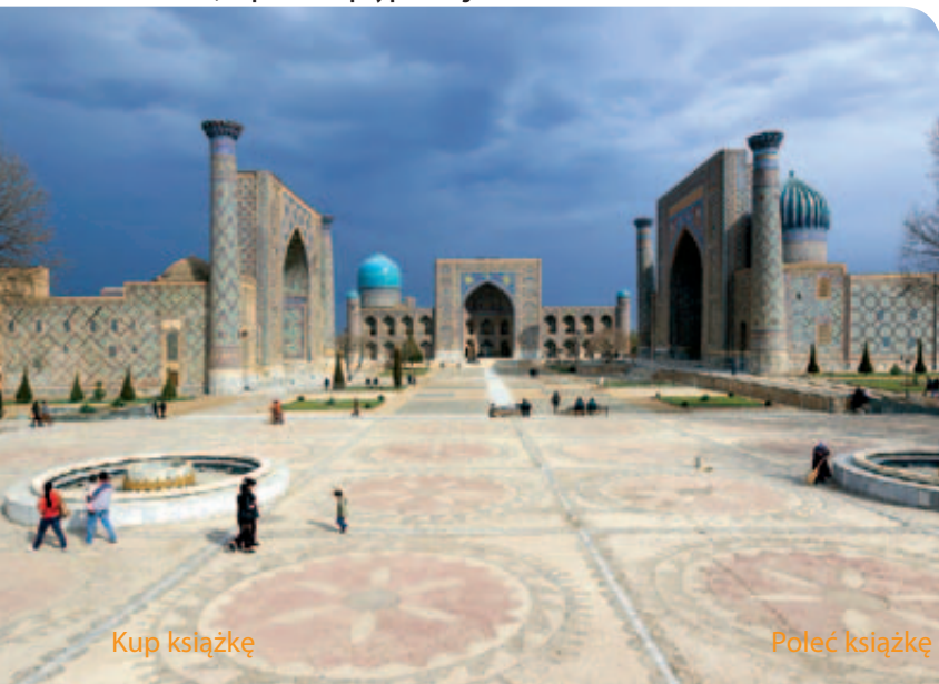
Samarkanda, zespół medres przy placu Registan