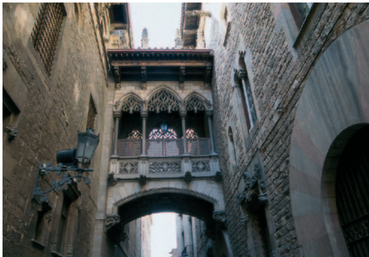
Neogotycka galeria przy ulicy del Bisbe Irurita

Z tyłu Pałacu Biskupiego usytuowany jest niewielki Plaza de Garriga i Bachs , z którego rozciąga się znakomity widok na przeciwległą bramę Santa Eulflia, prowadzącą do wrydarza katedry. Rzeźba zdobiąca jeden z jej boków, będąca hołdem dla mieszkańców