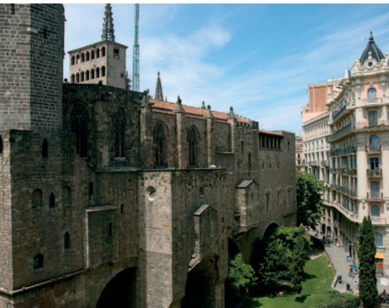
Zabytkowa architektura Barri Gòtic

W kaplicach rozmieszczonych wokół obejścia można podziwiać gotyckie i barokowe nastawy ołtarzowe, w tym słynne Przemienienie ★ Bernata Martorella uznawane za klasyczne dzieło gotyckiego malarstwa katalońskiego.