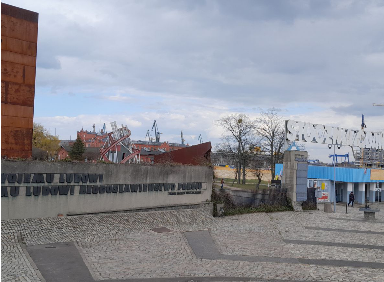
Fot.6. Teraz przez bramę wiedzie droga do Europejskiego Centrum Solidarności (po lewej stronie widać fragment ECS a po środku w oddali na tle chmur, dźwigi Stoczni Gdańskiej)

Milicja i wojsko otworzyły ogień. Były pierwsze ofiary śmiertelne i dużo osób zostało rannych. Wydarzenia te doprowadziły do zmian we władzach komunistycznych w Polsce oraz wykreowały przywódców, którzy później w sierpniu 1980 roku dali początek NSZZ „Solidarność”.