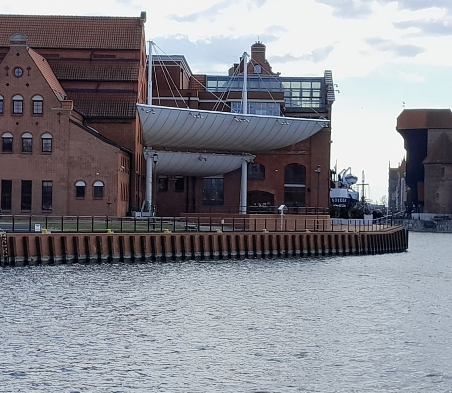
Fot. 10. Budynek filharmonii (po lewej) oraz Żuraw (po prawej) a pomiędzy nimi „wciśnięty” znajduje się statek muzeum - Sołdek

Warto wybrać się też do Archikatedry w Oliwie gdzie można posłuchać muzyki organowej. W Gdańsku natomiast warto zwrócić jeszcze uwagę na Teatr Wybrzeże (przy ulicy św. Ducha) czy Gdański Teatr Szekspirowski (ul. Bogusławskiego 1), który jest jednym polskim teatrem zbudowanym w stylu elżbietańskim.