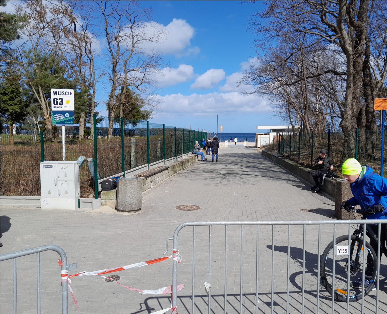
Fot. 3. W oddali kilka kilometrów przed metą (widać bariereki oddzielające) na chwilę pokazał się Bałtyk – resztkami sił udało mi się wyjąć komórkę i zrobić pierwsze i zarazem ostatnie zdjęcie podczas biegu

Przy ulicy Jantarowej był tylko jeden duży prześwit, w którym było widać wyraźnie morze. Choć drzewa nie miały jeszcze liści to na początku trudno było je wypatrzyć, choć wyraźnie było czuć jego oddech na naszych plecach.