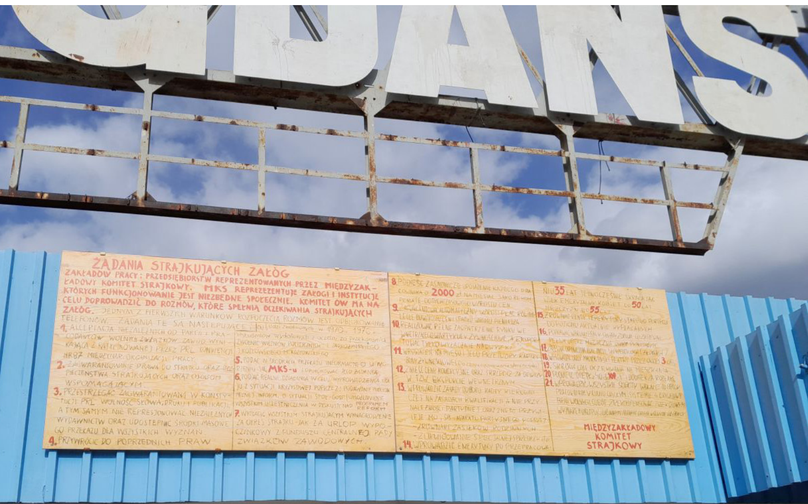
Fot. 8. Wiszą one też nad bramą Stoczni