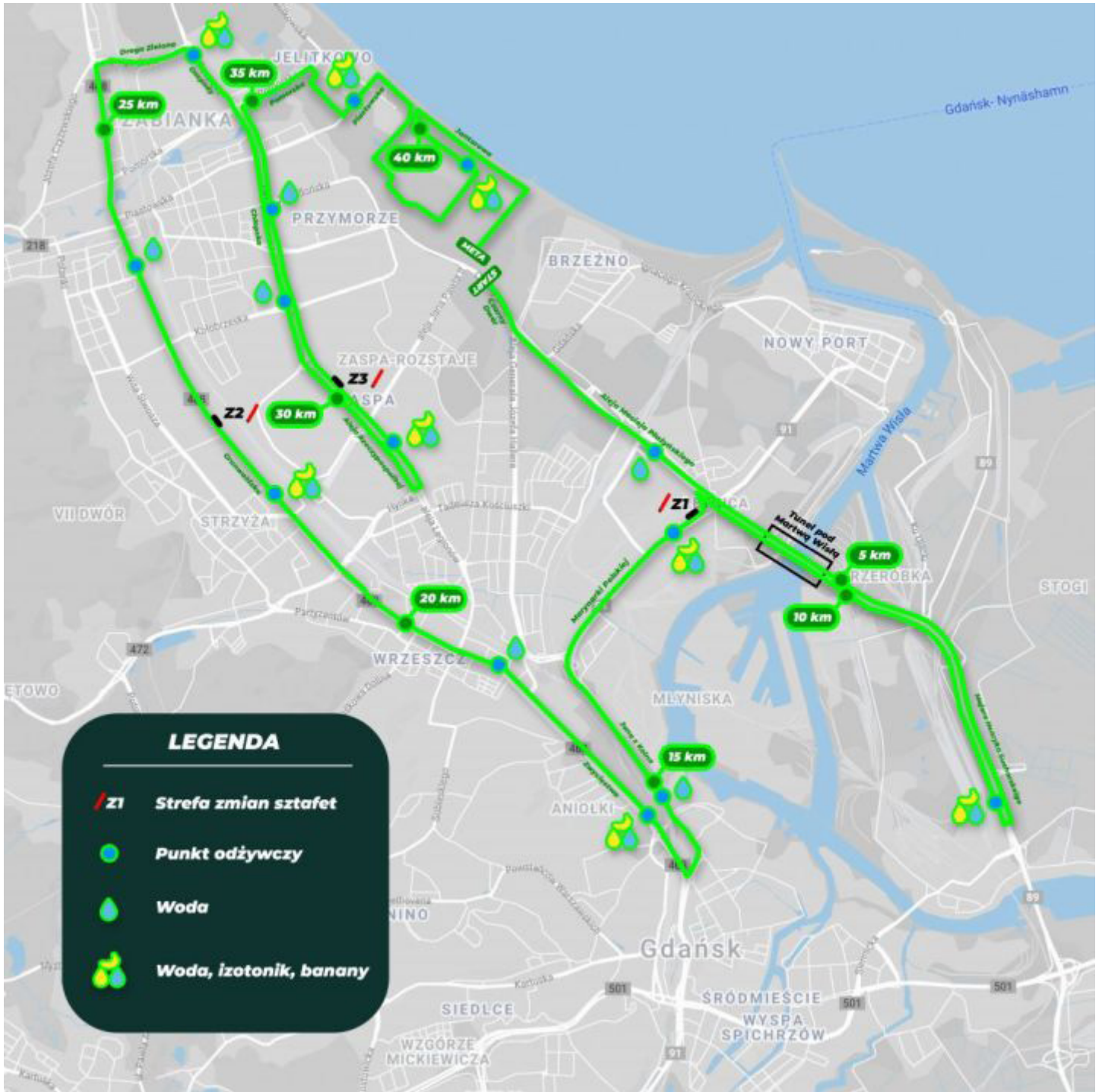
Fot.2. Mapa biegu