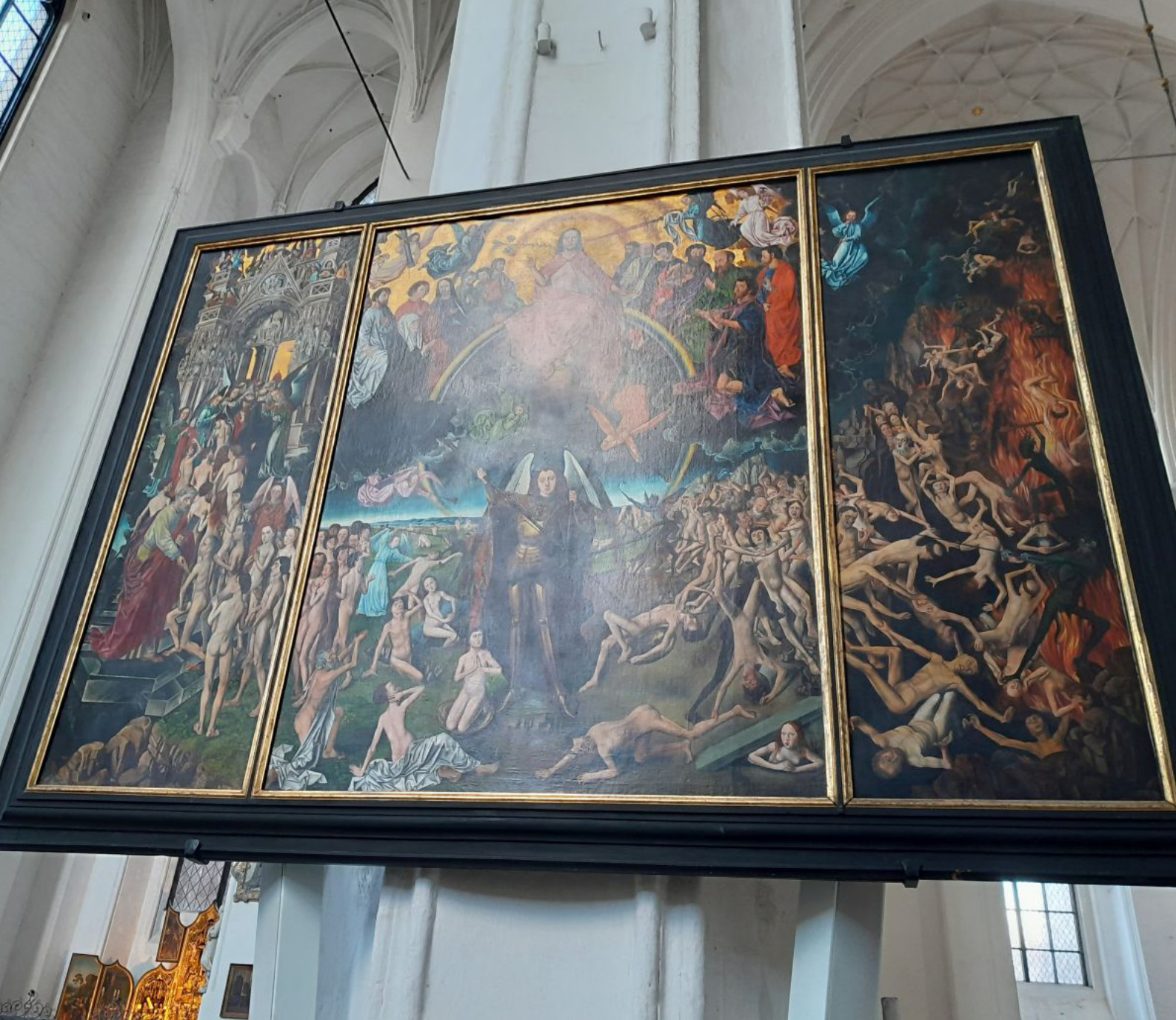
Fot. 11. Zdjęcie Reprodukcją tego dzieła możemy obejrzeć też w Kościele Mariackim

Kopia obrazu „Sąd Ostateczny” (XIX w.) Tempera, olej na desce, wymiary oryginału: partia środkowa 242 x 180 cm; skrzydła 242 x 90 cm.