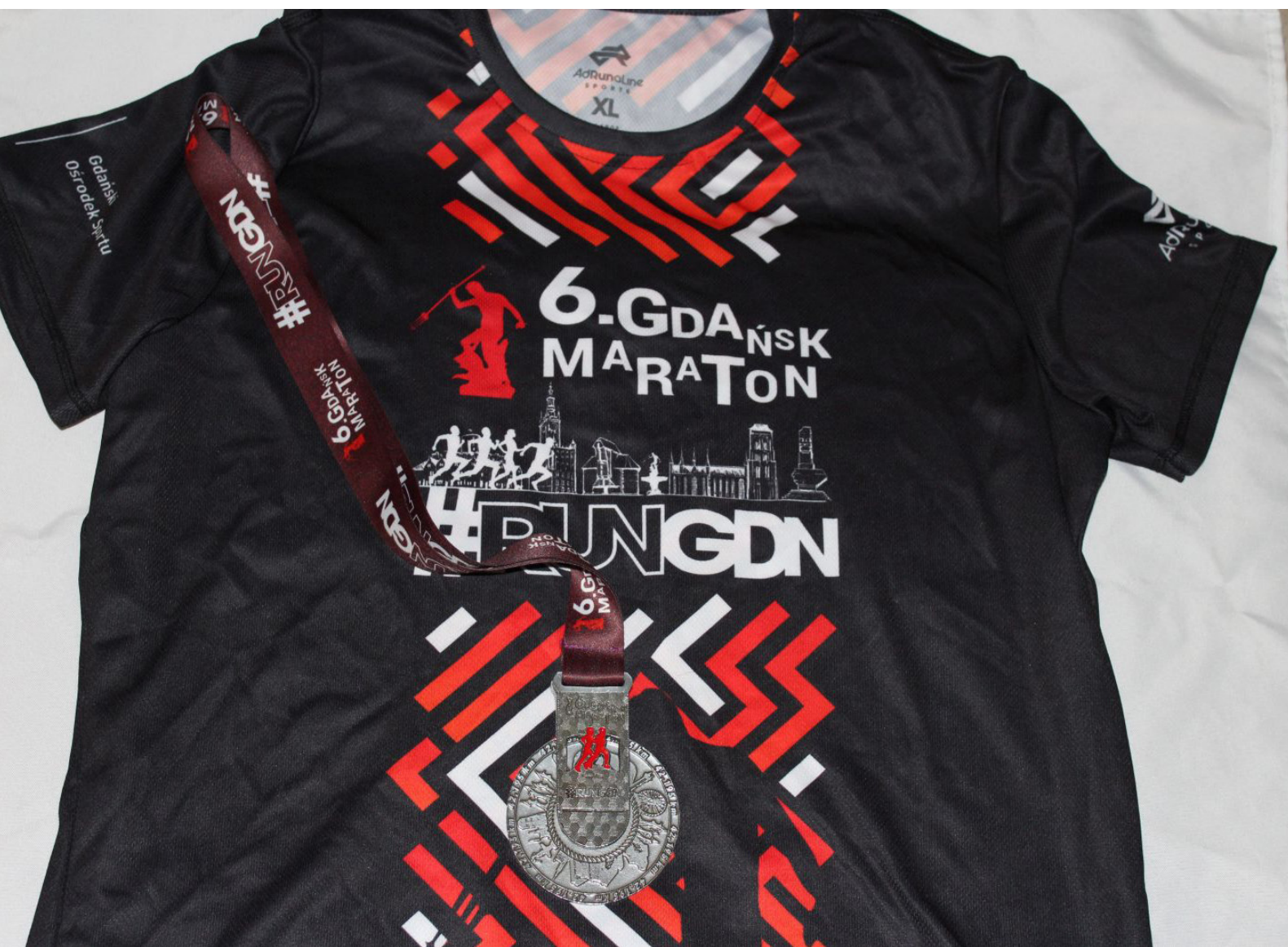
Fot.1. Trofea po biegu: medal i koszulka (tym razem nie wchodziła w zakres pakietu startowego i trzeba ją było dokupić)