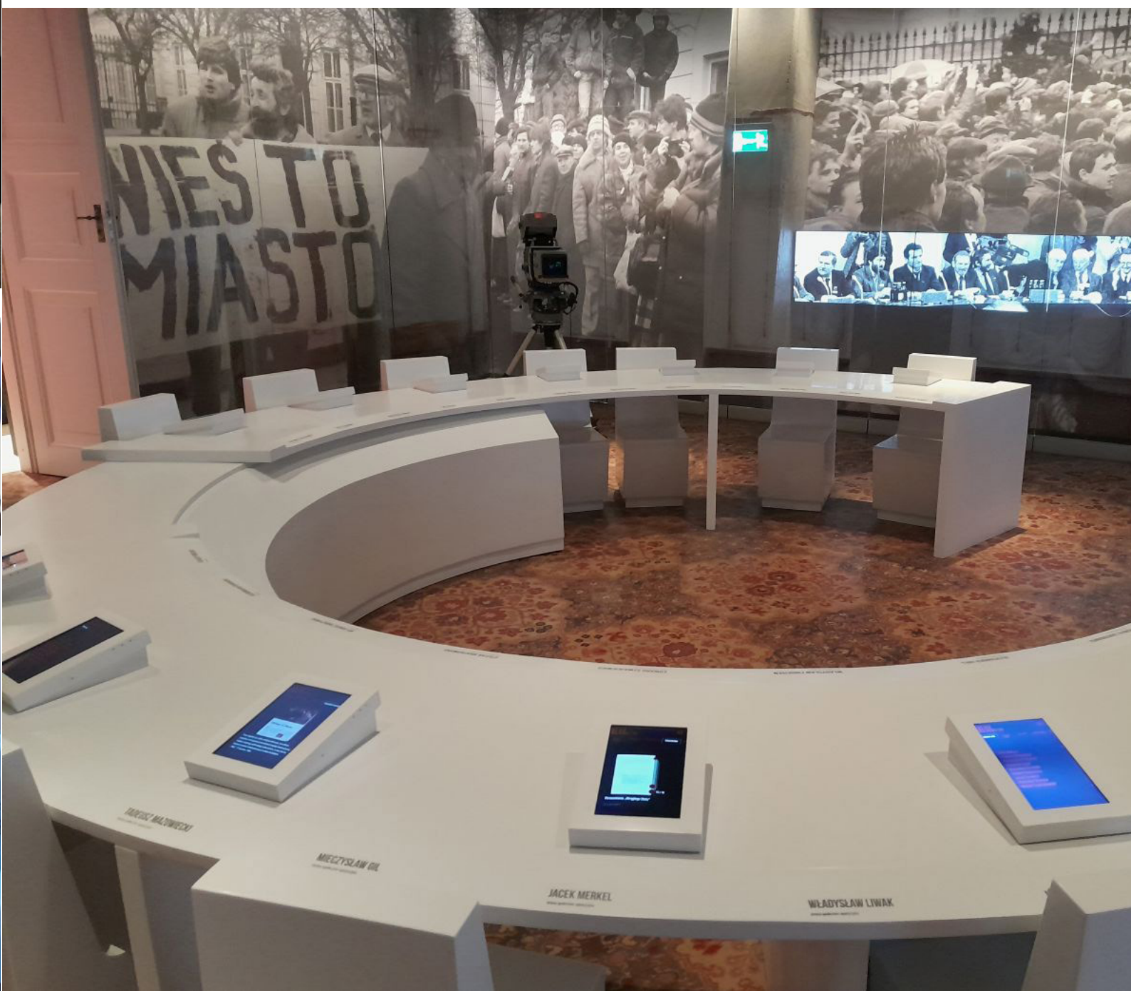
Fot. 9. Okrągły Stół znajdujący się w ECS wraz z tabliczkami oznaczającymi osoby, które przy nim zasiadały

Strajki trwały aż do podpisania przez władze porozumienia w ostatni dzień sierpnia 1980 roku. Przywódca strajku w stoczni Gdańskiej, elektryk Lech Wałęsa stał się przywódcą nowego ruchu, do którego przystąpiło wtedy 10 milionów Polaków. Walka o zmiany została zastopowana, kiedy I sekretarz partii komunistycznej gen. Wojciech Jaruzelski wprowadził 13 grudnia 1981 w Polsce stan wojenny. Przywódcy strajków, nie tylko w Gdańsku zostali internowani a NSZZ został zdelegalizowany. Do kolejnych strajków w stoczni Gdańskiej doszło w 1988 roku. Rozpoczęły się rozmowy Okrągłego Stołu, które doprowadziły do pierwszych, częściowo wolnych wyborów w 1989 roku.