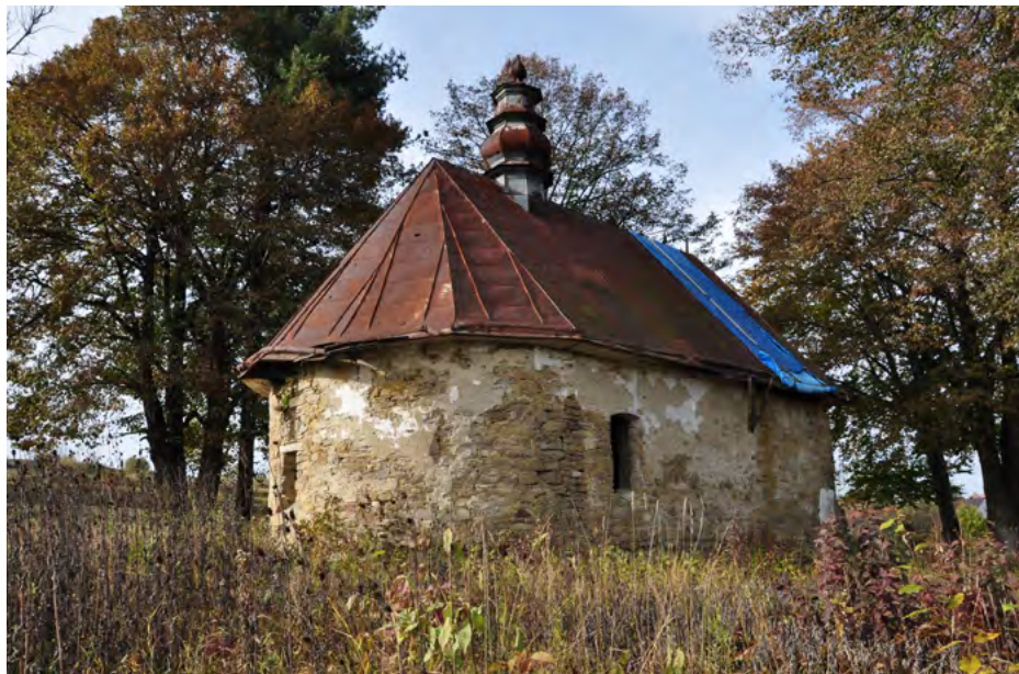
Elewacja wschodnia i północna

Cerkiew przez lata niszczała, groziła zawaleniem. W 2012 r. podjęto prace zabezpieczające. Kamienne wnętrze jest puste.