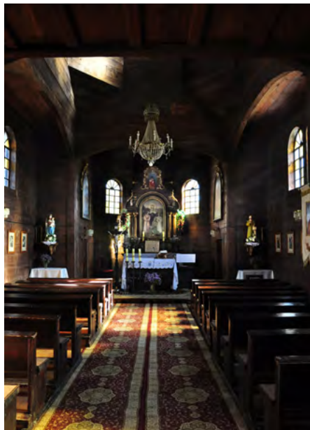
Nawa i prezbiterium