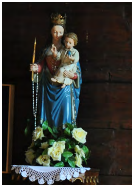
Rzeźba Matki Boskiej z Dzieciątkiem, w nawie