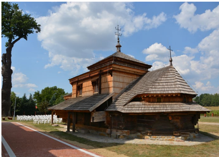
Elewacja wschodnia i północna