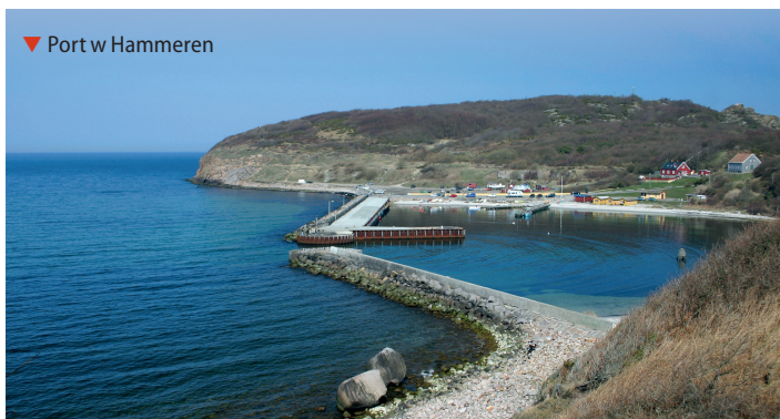
▼ Port w Hammeren

Znacznie większym akwenem jest ★ Hammersøen powstałe po wycofaniu się stąd lodowca. To największe jezioro Bornholmu (10 ha). Jego względnie duża głębokość (13 m) i położenie blisko morza skusiły Piotra Wielkiego do powzięcia planów zamienienia zbiornika w główny basen portowy przyszłej bazy morskiej. W czasie wizyty na Bornholmie w 1716 r. car dyskutował