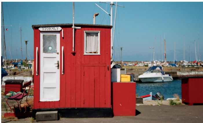
▲ Budka sztormowa w porcie w Rønne

z barwniejszych postaci związanych z Rønne. Po zakończeniu wojny z Anglią na pocz. XIX w. korsarz miał duże kłopoty ze znalezieniem sobie miejsca w świecie o nowym porządku. Zajął się więc szmugłem alkoholu. Król nie bardzo wiedział, jak ma sobie z nim poradzić, mianował więc Wolffsena urzędnikiem celnym w Rønne (później odpowiedzialnym za całą wyspę).