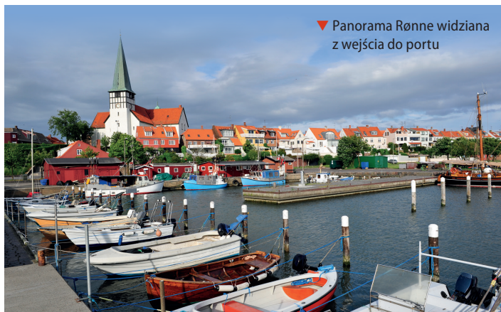
▼ Panorama Rønne widziana z wejścia do portu