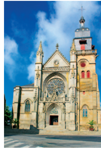
Kościół św. Leonarda w Fougères

Kościół z XV–XVI w. wyróżnia się bogato dekorowaną fasadą. We wnętrzu na szczególną uwagę zasługują współczesne witraże. W kaplicy po lewej stronie od wejścia znajduje się witraż z XII w. przedstawiający dwie sceny z życia św. Benedykta. W kaplicy z chrzcielnicą warto zwrócić uwagę na późniejszy witraż, w który wmontowano dwa fragmenty witraży ★ z XVI w.