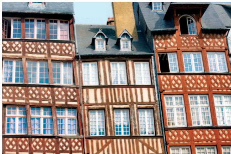
Zabudowa szachulcowa w Rennes

formułą, której zwykle używał przy podobnych okazjach: „Są to piękne klucze, lecz większą radość sprawiają mi klucze do serc mieszkańców”.