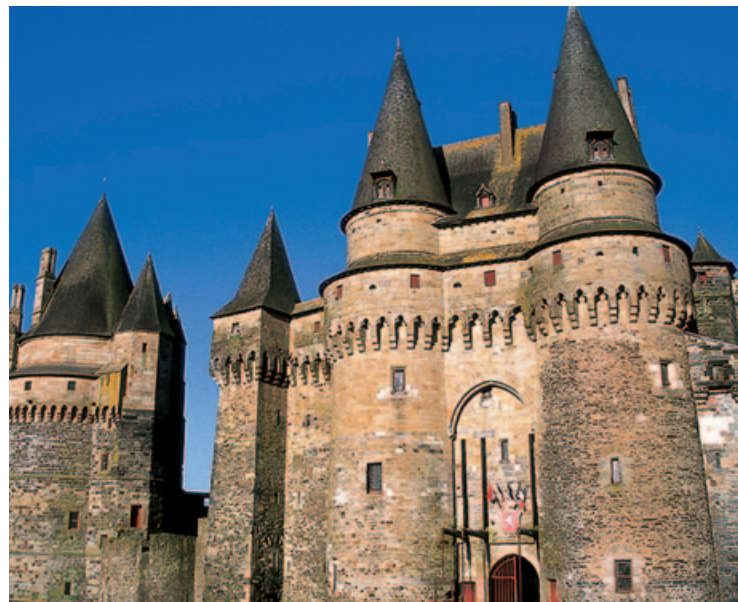
Baszty zamku w Vitré

Maison de la Roche-aux-Fées – Essé – tel.: 02 23 31 03 13 – VII–VIII: 11.00–18.00; V, VI i IX: sb.–nd. i święta 11.00–18.00. W pobliżu grobowca znajduje się centrum informacji turystycznej organizujące ciekawe wystawy i imprezy.