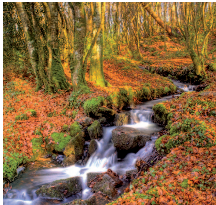
Tajemnicza atmosfera lasu Brocéliande stała się inspiracją dla powstania wielu legend

To właśnie w tym mitycznym lesie można znaleźć miejsca związane z ważnymi postaciami cyklu legend arturiańskich. Najsłynniejszą z nich jest czarnoksiężnik Merlin, którego grób znajduje się niedaleko Źródła Wiecznej Młodości. Podania nie określają, gdzie znajduje się skała, z której Artur wyciągnął miecz Ekskalibur, ani gdzie stał Okrągły Stół dla 365 rycerzy króla, ale same imiona Lancelota czy Wiwiany wystarczą, by mieć wrażenie, że wstąpiło się do krainy legend.