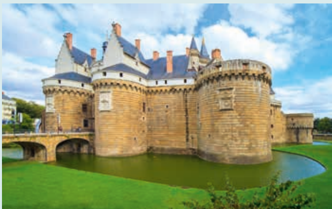
Château des Ducs de Bretagne, Nantes

Na Półwyspie Bretońskim zachowało się bardzo wiele miast i zabytków średniowiecznych, niemal klasycznych w swoim wyglądzie. Średniowieczne zamki z prawdziwego zdarzenia zobaczymy przede wszystkim w Vitré , Nantes oraz w Josselin (zbudowany w majestatycznym stylu gotyku płomienistego zamek księżąt Rohan). Warto odwiedzić również położony na wcinającym się w ocean skalistym cyplu fort La Latte . Z kolei na szlaku fanów średniowiecznych fortyfikacji powinny znaleźć się otoczone świetnie zachowanymi murami miejskimi Vannes oraz Fougères .