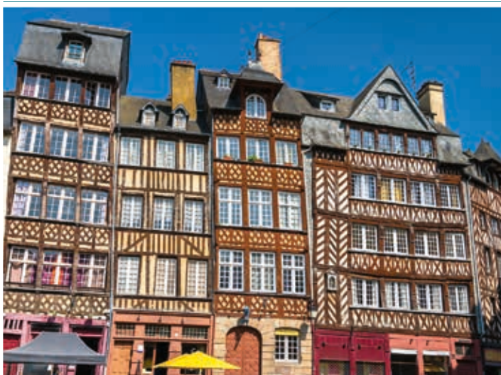
Domy szachulcowe w Rennes

Ze względu na duże zalesienie Bretonii tradycja budownictwa szachulcowego przetrwała tu aż do XIX w. W Rennes znajduje się 280 domów o drewnianej konstrukcji szkieletowej. Najstarsze budynki pochodzą z XV w. i mają duże nadwieszenia. Budowle XVI-wieczne można rozpoznać po mniejszych nadwieszeniach i dekoracjach z motywami renesansowymi (arabeski, putta itd.). Domy z XVII w. wyróżniają się całkowicie płaskimi, symetrycznymi fasadami. Z kolei w kamienicach z XVIII w. drewniana konstrukcja szkieletowa była stopniowo zasłaniana tynkiem.