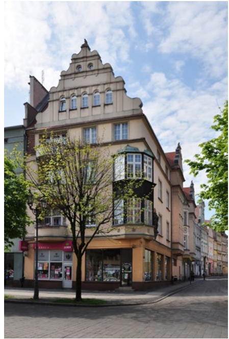
Jabłkowa 1, pierzeja południowa Rynku Jabłkowa 1 (elewacja zachodnia)