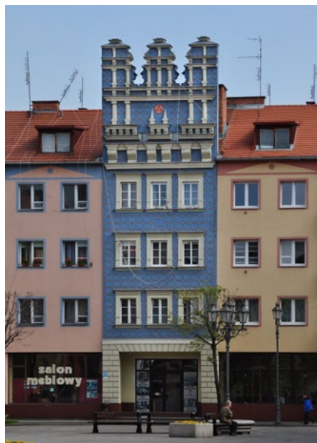
Rynek 18 (pierzeja północna)

Przy Rynku zachowały się kamienice mieszczańskie.