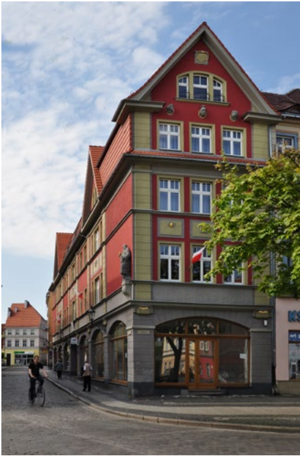
Kamienica z 1915, ul. Mieczna 2, pierzeja południowa Rynku Rynek 4