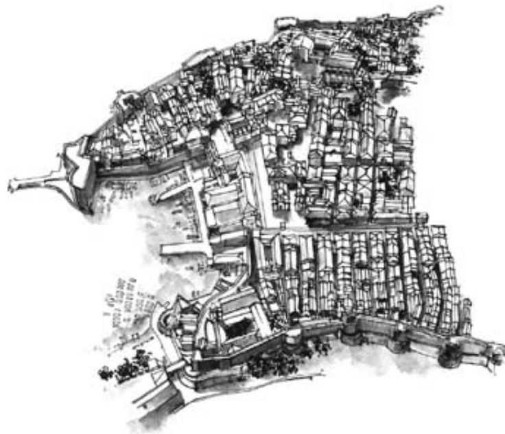
► Panorama Starego Miasta, rys. W. Kwiecień-Janikowski

Wznosi się on na wystającej z morza skale o wysokości 37 m (wstęp w ramach biletu pozwalającego na zwiedzanie murów miejskich – ☉ codz. 8.00–19.00; dorośli 50 HRK, dzieci 20 HRK). Z daleka fort wygląda imponująco – samotna, potężna twierdza na skalistym półwyspie. Budowla owiana jest tajemnicą i krążą o niej liczne legendy. Jedna z nich odnosi się do tradycyjnych zatargów mieszkańców Dubrownika z Wenecjanami i mówi o tym, jak twierdza powstała. Podobno Wenecjanie postanowili wybudować w tym miejscu fortecę, która miałaby pomóc w utrzymywaniu kontroli