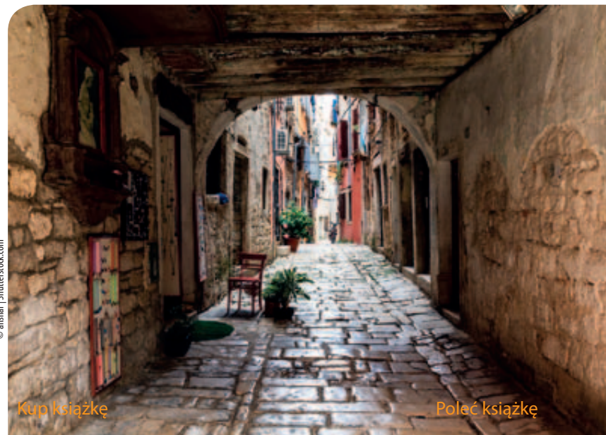
Uliczka w Rovinju