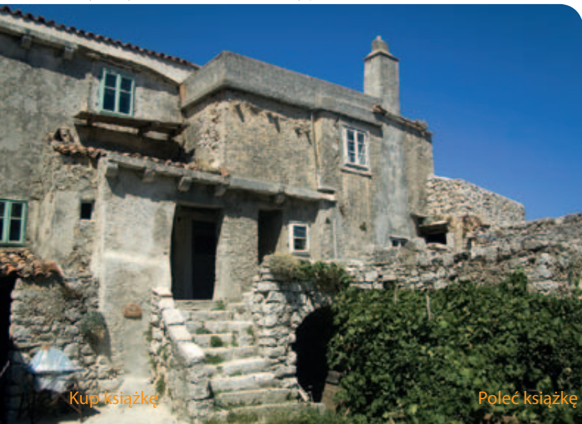
Stary dom rybaka w miasteczku Lubenice (wyspa Cres)