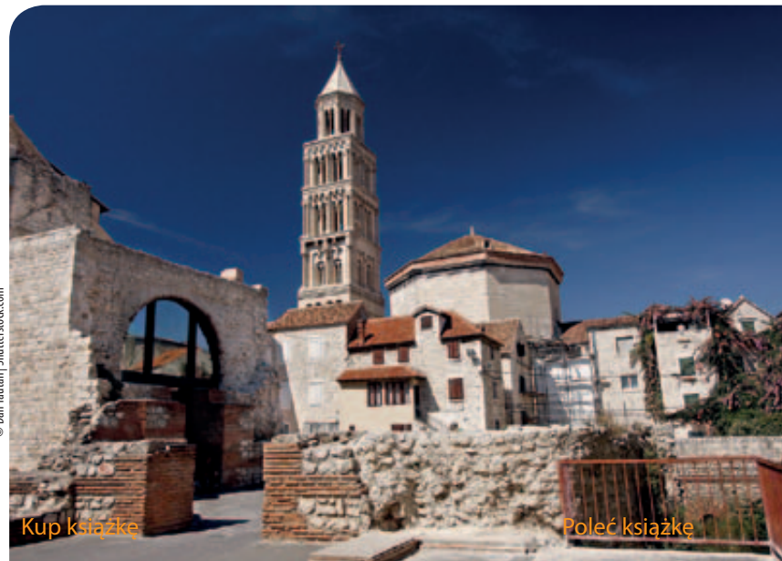
Split, katedra św. Dujama