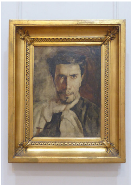
Ștefan Luchian, Autoportret, 1908