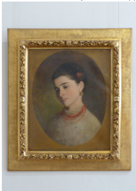
Nicolae Grigorescu, Głowa dziewczyny