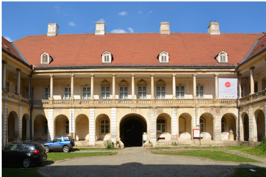
Pałac Bánffy, dziedziniec, skrzydło wschodnie

Pomimo że budynek jest późnobarokowy, to dziedziniec wewnętrzny z krużgankami nawiązuje do renesansu.