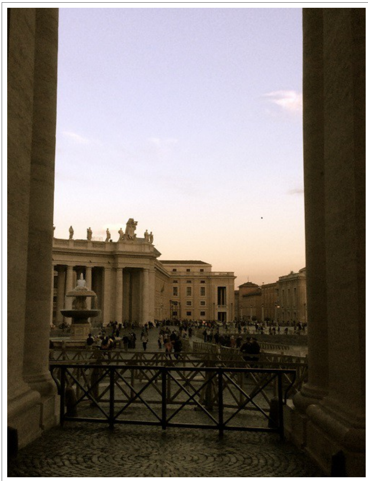
Ryc. 2. Watykan. Widok na plac św. Piotra.