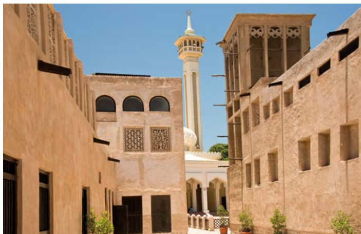
▲ Historyczna dzielnica Bastakiya, znana również jako Al Fahidi Historical Neighbourhood.