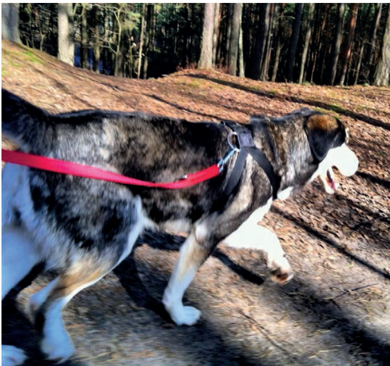
Fot. 67. Gdy wejdzie w tryb biegowy, nie lubi się zatrzymywać