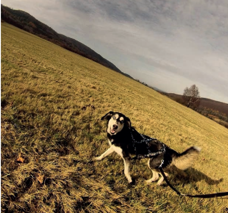
Fot. 68. Łyszek świetnie czuje się na długich biegach w górach

mieć dużo ruchu, czy jest raczej kanapowcem. W żadnym momencie nie wolno dać się ponieść emocjom — należy „na chłodno” ocenić, czy nasz dom jest gotów na przyjęcie nowego lokatora oraz czy jesteśmy gotowi spędzić z nim następne kilkanaście lat swojego życia.