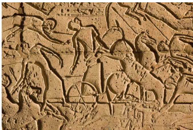
▲ Bitwa pod Kadesz – relief z Ramesseum

Kto wygrał bitwę? Trudno jednoznacznie określić, ale nie przeszkodziło to faraonowi chełpić się swym męstwem, rozkazując to dyskusyjne zwycięstwo uwiecznić na płaskorzeźbach m.in. w Ramesseum i Karnaku.