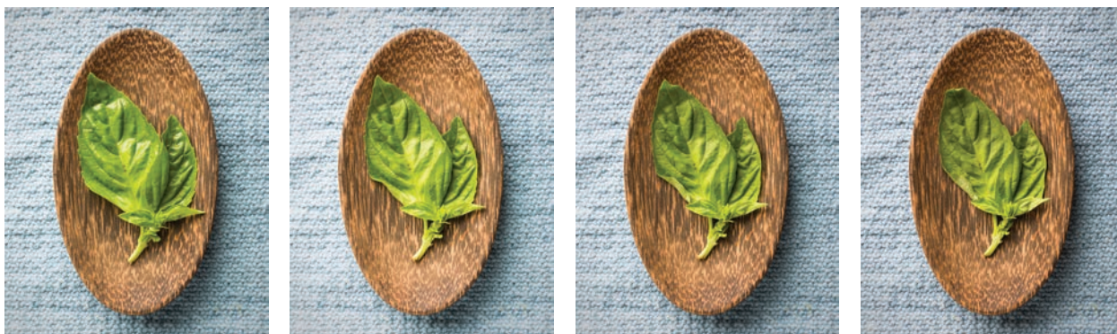
3.5. Ta sekwencja zdjęć pokazuje, jak bardzo w ciągu godziny może się zmienić zwykłe zioło, takie jak bazylija — ze świeżego i zielonego staje się blade i pomarszczone

Rolę zamiennika może odgrywać dosłownie wszystko. Doskonale zdają egzamin produkty niewymagające przyrządzenia (takie jak bułka do hamburgera). Można użyć właściwie dowolnego przedmiotu przypominającego kolorystyką fotografowaną potrawę (zdjęcia 3.6 oraz 3.7). Spróbuj poszukać czegoś o zbliżonym kształcie, szerokości czy wysokości, by móc odpowiednio zaaranżować kompozycję (szczególnie jeśli używasz statywu).