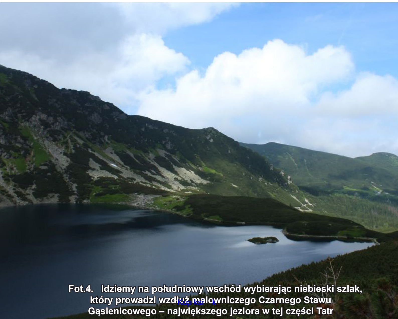
Fot.4. Idziemy na południowy wschód wybierając niebieski szlak, który prowadzi wzdłuż malowniczego Czarnego Stawu Gąsienicowego – największego jeziora w tej części Tatr

Po pobudce i po śniadaniu już z małymi plecakami kierujemy się na Granaty.