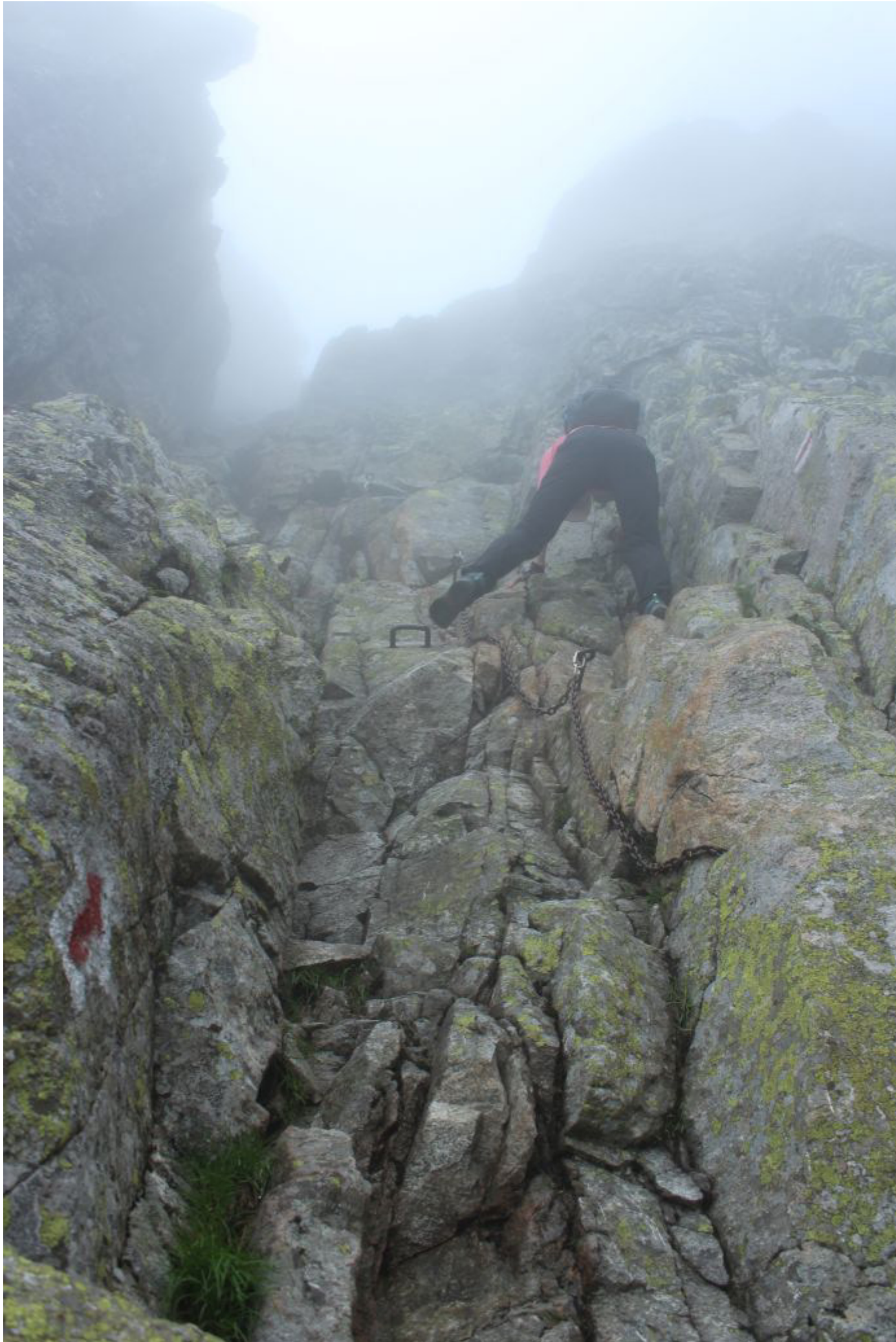
Fot.6. Jest ciągle sucho, i choć momentami zejście jest strome, to dzięki zabezpieczeniom (klamrom i łańcuchom) pokonujemy przeszkodę