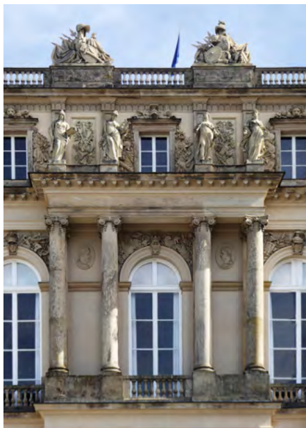
Skrzydło zachodnie, elewacja zachodnia