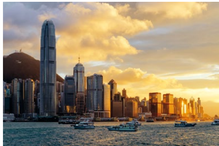
Widok na Hongkong, w tle Victoria Peak

Kolejka o nazwie Peak Tram działa od 1884 r. Została zbudowana przez właściciela hotelu na wzgórzu, który chciał dać swoim gościom łatwy i szybki dostęp na górę, wygodniejszy niż krzesła noszone przez tragarzy. W 1888 r. na mocy decyzji gubernatora kolejkę otwarto dla wszystkich. Od tego czasu dwa wagoniki Peak Tram przewożą niestrudzenie pasażerów na wierzchołek góry.