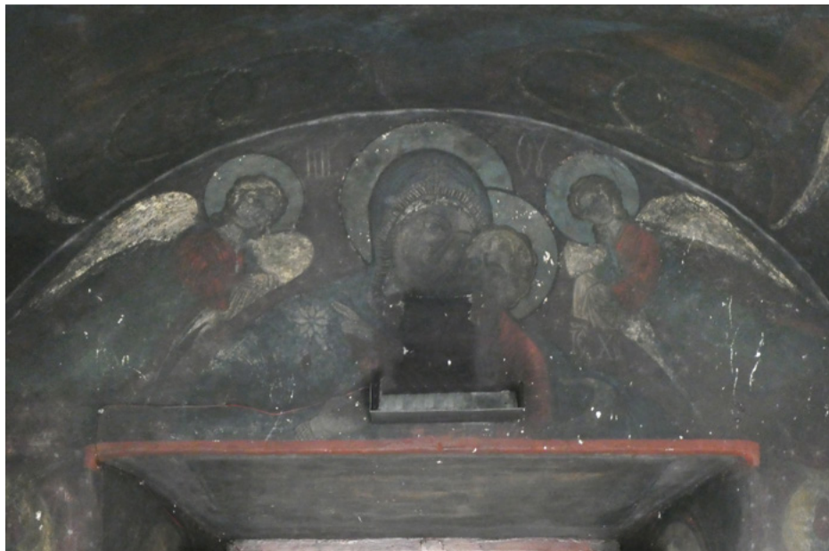
Polichromie w kruchcie

Świątynia jest nietypowym połączeniem gotyku (absyda i wieża dzwonicza) z architekturą bizantyjską.