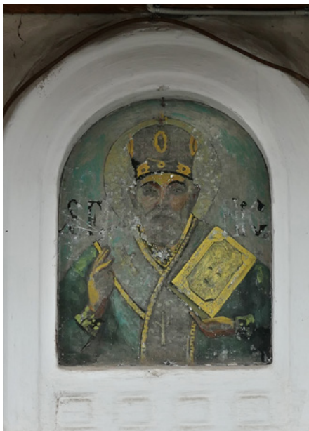
Wizerunek św. Mikołaja na dzwonnicy (elewacja zachodnia)

Cztery potężne filary podtrzymują kopułę. Drewniany, rzeźbiony ikonostas został wykonany w XVIII w.