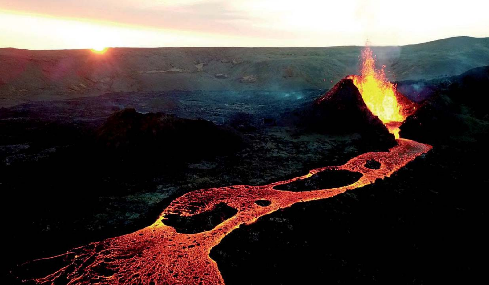
Fot. Erupcja Geldingadalir, 29 Kwietnia 2021