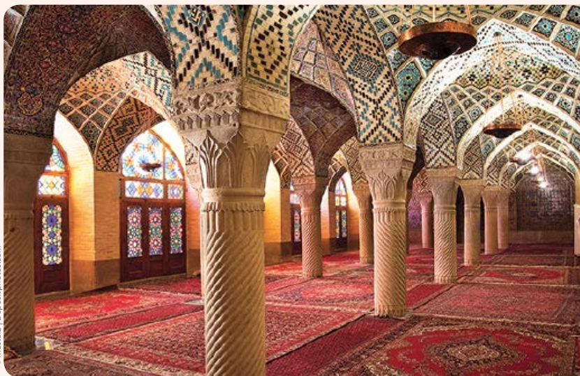
W meczecie Nasir al-Molka

To jedno z najważniejszych kulturalnych miast w Iranie, położone u podnóża gór Zagros. Sziraz przez stulecia był ważnym ośrodkiem na handlowym szlaku Persji. Za czasów panowania dynastii Zandów pełnił funkcję stolicy Iranu. Większość atrakcji turystycznych pochodzi właśnie z tego okresu. Sziraz to przede wszystkim miasto najznakomitszych perskich poetów: Hafeza oraz Sa'diego, których mauzolea corocznie przyciągają wielbicieli perskiej poezji klasycznej. Więcej zob. s. 182.