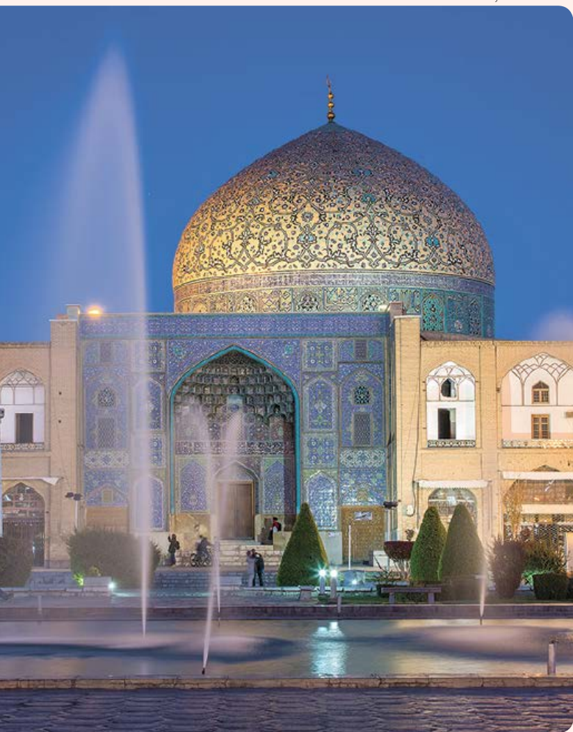
Meczet Szejka Lotfollaha

Isfahan jest trzecim pod względem wielkości miastem Iranu i jednym z najbardziej zróżnicowanych pod względem religijnym: żyją tu muzułmanie, chrześcijanie, Żydzi oraz zaratusztrianie. Irańczycy nazywają Isfahan Nesf-e Dżahan, czyli „połową świata”, gdyż uważają, że po jego zobaczeniu widziało się już połowę piękna występującego na świecie. Więcej zob. s. 167.