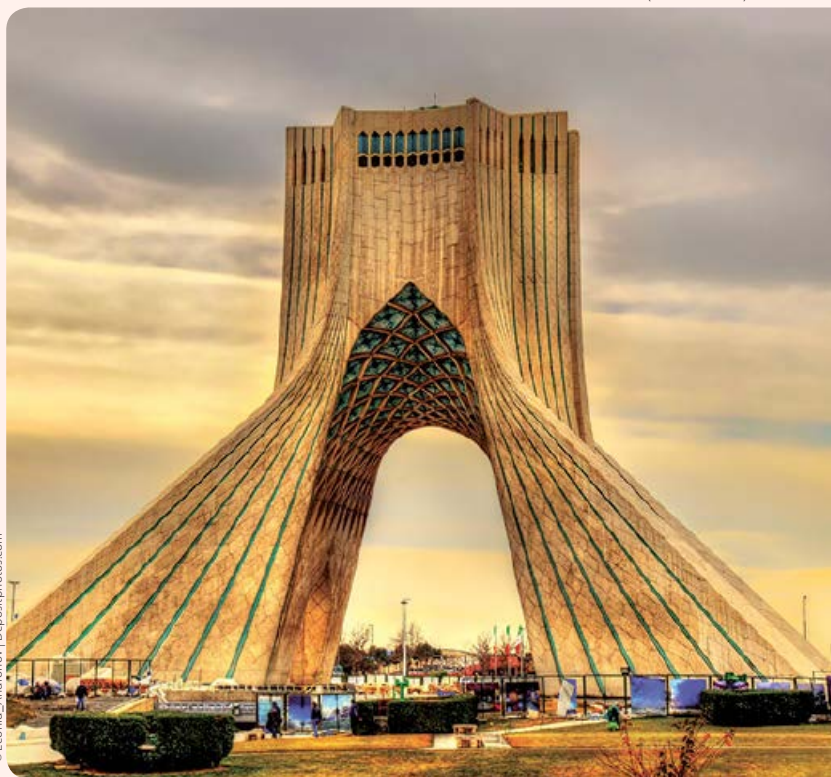
Wieża Wolności (Bordż-e Azadi)

Teheran jest tym miastem, które się kocha lub nienawidzi. Niemal dziewięćmilionowa metropolia powstała z niewielkiej wioski zaledwie 250 lat temu i w przeciągu dwóch wieków urosła tak bardzo, że z roku na roku pochłania mniejsze miejscowości znajdujące się na jej obrzeżach. Powstają tu bloki mieszkalne i coraz to nowsze apartamenty. Architektoniczny rozwój miasta i anonimowość jego mieszkańców powoduje, że Teheran różni się od innych miast Iranu. Warto wyrobić sobie własne zdanie o tej olbrzymiej metropolii. Więcej zob. 118.