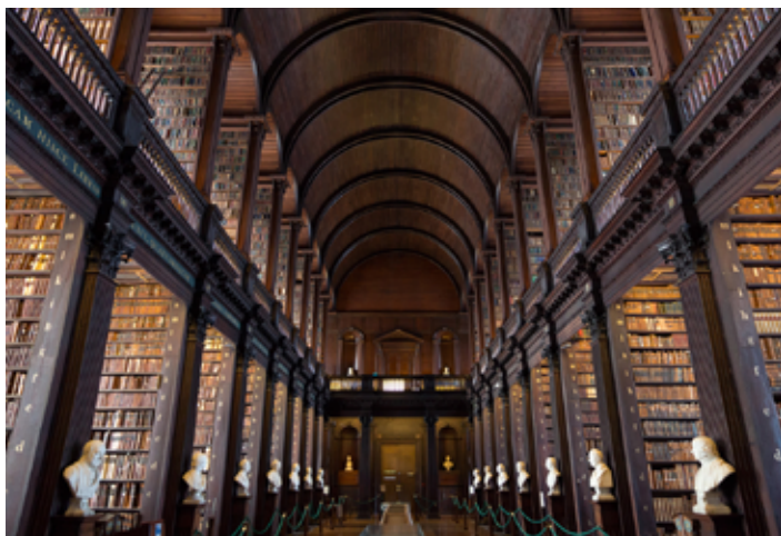
▲ The Long Room

normalny, 5 EUR ulgowy, w którym raz na kilka miesięcy studenckie kółko teatralne wystawia nowe sztuki. Warto śledzić stronę internetową, gdyż są na niej zamieszczane informacje dotyczące bieżących przedstawień.