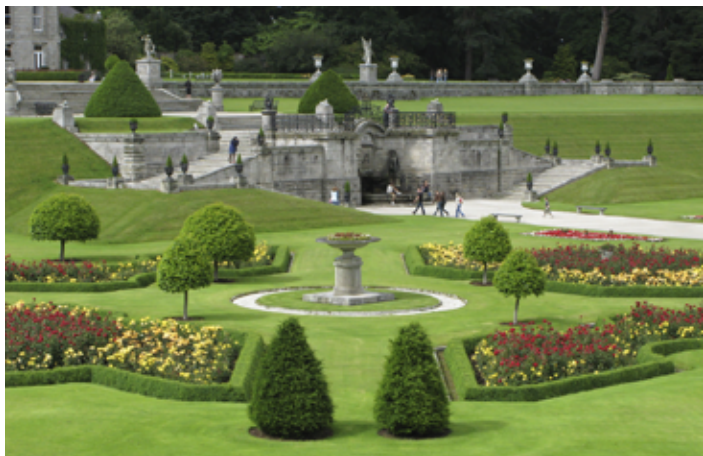
▲ Ogród włoski, Powerscourt

Pond , którą otaczają okazałe drzewa, a także fikuśna, zielona kryptomeria japońska ( Cryptomeria japonica ).