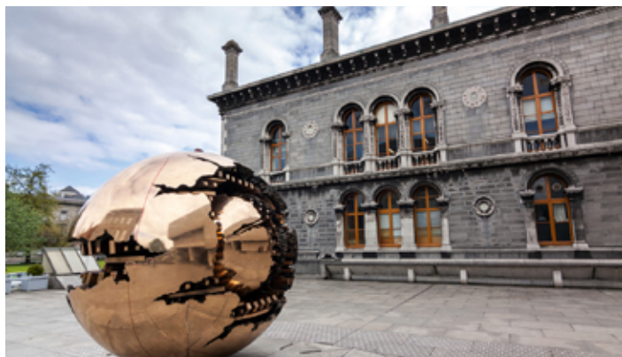
▲ Zabytkowe zabudowania Trinity College

Trinity College zajmuje teren o powierzchni ponad 47 akrów (190 tys. m 2 ) przy placu College Green. W jego obrębie mieszczą się: kampus akademicki, zabytkowa biblioteka, teatr publiczny,