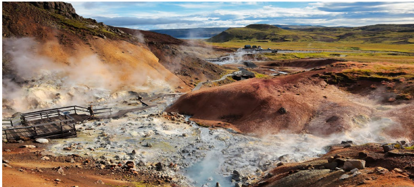
▼ Obszar geotermalny Krýsuvík

To jedno z najliczniej zamieszkiwanych przez ptaki miejsc na Islandii, a być może i w całej Europie. Pionowe ściany wpadające wprost do oceanu są domem dla tysięcy ptaków – głównie mew, nurzyków i alk. Od połowy marca do końca sierpnia można tu obserwować maskonury – symbol Islandii. Przy odrobinie szczęścia naszym oczom ukażą się również pływające w pobliżu brzegu wieloryby i delfiny. Fale morskie, uderzając o skaliste wybrzeże, nadają mu formę urwisk. Klify ciągną się na długości ok. 7 km. Ich przeciętna wysokość wynosi 50 m, a w najwyższym miejscu sięgają ok. 70 m, co czyni je największymi klifami południowo-zachodniej Islandii. Szlak pieszy prowadzi do maleńkiej latarni morskiej, wzniesionej w 1965 r. Rozpościera się stąd wspaniały widok na ocean. Do klifów Krýsuvíkurborg zaleca się dojazd samochodem terenowym.