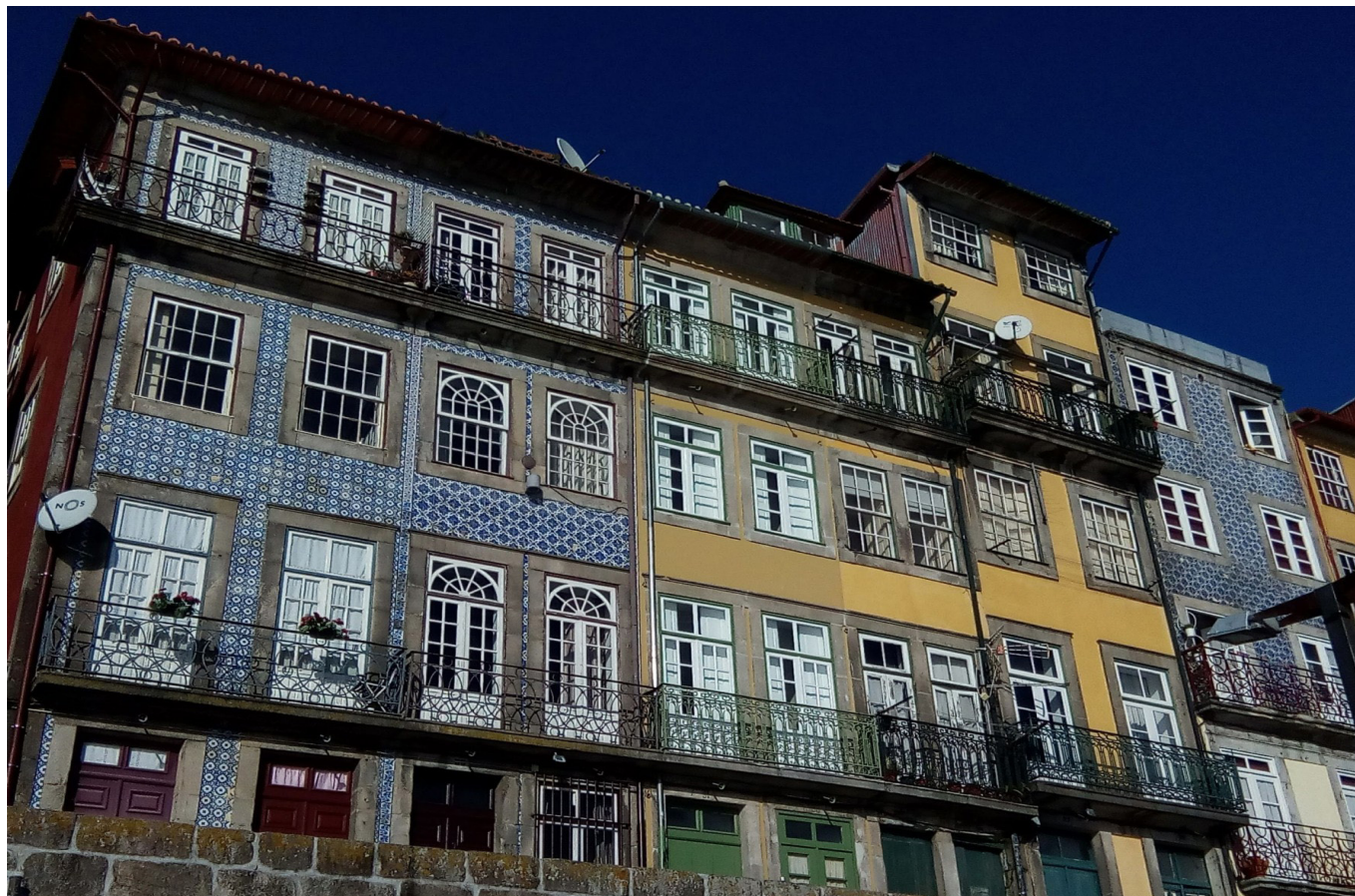
Porto, Portugalia. Grudzień 2019.

D ługo zastanawiałam się, w którym miejscu tego poradnika umieścić zapis o wieku. Pierwszy pomysł był taki, aby potraktować go jako podsumowanie książki, więc dać go na koniec. Po głębszym zastanowieniu jednak uznałam, że ten temat powinien dać początek całej historii o niezależnym podróżowaniu tzw. własnym sumptem. Doszłam do wniosku, że żyjąc przez całe lata w Polsce, a tym samym bardzo konserwatywnym i mentalnościowo - potwornie zaściankowym kraju, bariera wieku jest w wielu okolicznościach czynnikiem hamującym, jeśli nie kompletnie dyskwalifikującym człowieka z jakiegokolwiek działania. Podróżowanie z plecakiem utożsamia się głównie ze studentami, a potem to już tylko hotelowe all inclusive, jeśli Cię stać i jeśli lubisz taką formę wypoczynku. Dotarło to do mnie dopiero po wyjeździe z Polski w roku 2014, kiedy będąc już w grupie 40+ postawiłam wszystko na jedną kartę i postanowiłam wyjechać, bynajmniej nie w przysłowiowe Bieszczady.