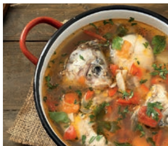
▲ Zupa rybna

Porządnie schłodzona galareta z mięsa lub ryb.