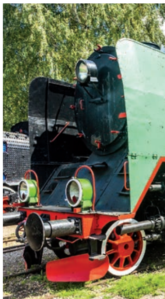
▲ Muzeum Kolejnictwa w Kościerzynie