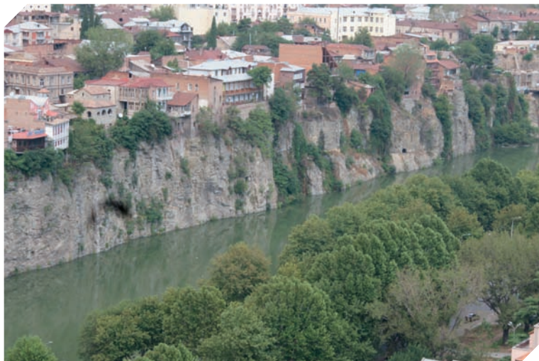
Brzeg rzeki Kury (gruz. Mtkvari) w Tbilisi