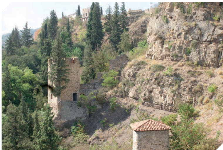
Twierdza Narikala górująca nad Tbilisi