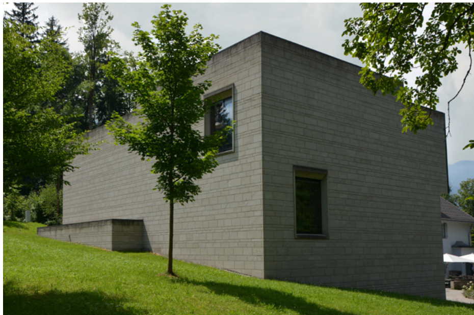
Nowy budynek (z 2008), zaprojektowany przez architektów szwajcarskich

Muzeum Franza Marca (Franz Marc Park 8–10) prezentujące dzieła wybitnego ekspresjonisty niemieckiego powstało w 1986 r.