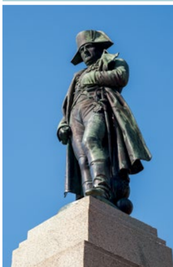
Pomnik Napoleona w jego rodzinnym mieście

Pierwsze piętro – Mimo że pierwotne wyposażenie pokoju narodzin