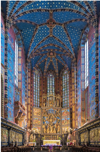
▲ Prezbiterium kościoła Mariackiego