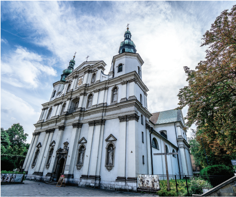
▲ Kościół św. Bernarda ze Sieny

Przybycie tego zakonu do Krakowa wiąże się ze św. Janem Kapistranem, który w 1453 r. trafił do miasta i na krakowskim Rynku Głównym wygłaszał płomienne kazania wzywające do pokuty za grzechy, walki ze zbytkiem i zepsuciem. Pod jego wpływem wierni przynosili „grzeszne” przedmioty, które następnie palono. Dużo trwalszym efektem jego kazań było wstąpienie przeszło 100 osób do założonego przez kaznodzieję właśnie w Krakowie nowego zakonu, w Polsce popularnie zwanego bernardynami.