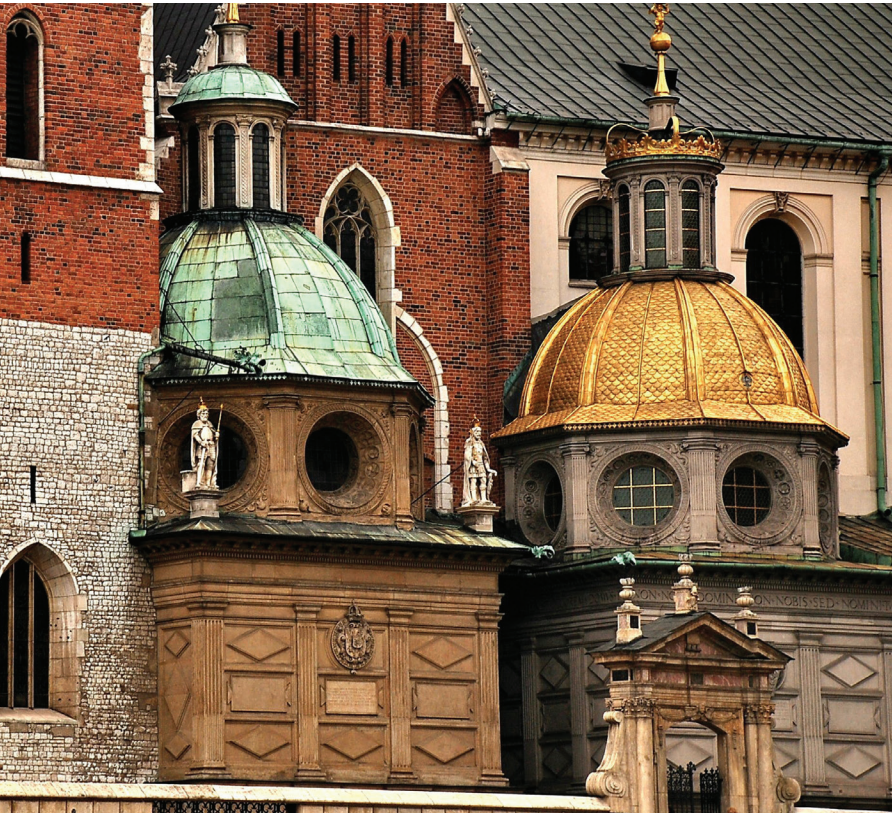
▲ Kaplice Wazów oraz Zygmuntońska przy wawelskiej katedrze