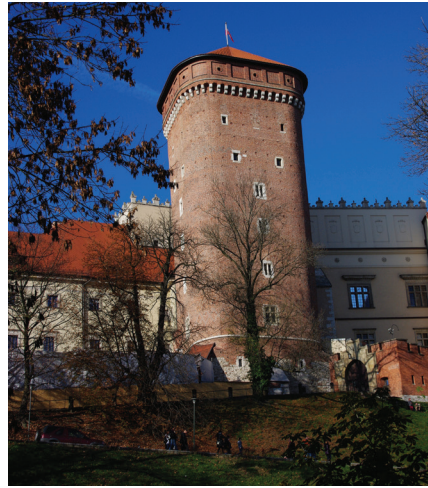
▲ Baszta Senatorska

Omijając wzniesiony przez władze austriackie potężny gmach, obecnie mieszczący centrum wystawowo-konferencyjne, dostrzeżemy trzecią z zachowanych w całości baszt obronnych Wawelu. Jest