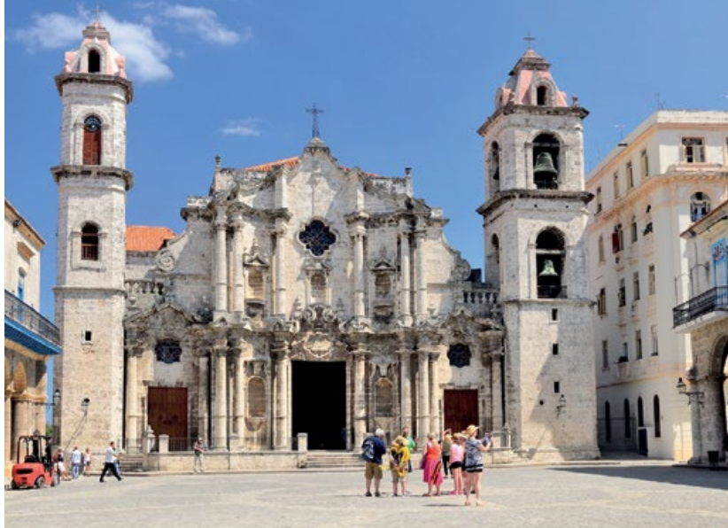
Catedral de San Cristóbal