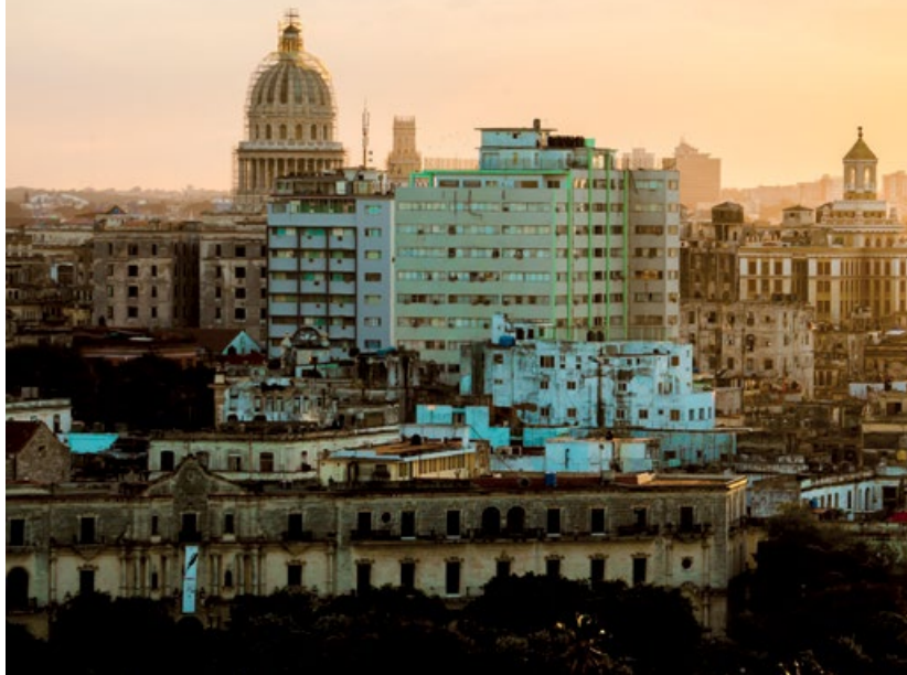
Hawana – czas zaklęty w budynkach