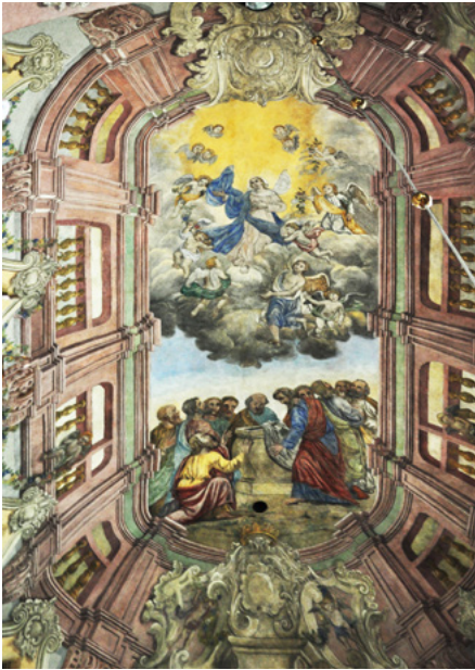
Sklepienie w prezbiterium, polichromia z 1861

Wyposażenie pochodzi z baroku, z XVII i XVIII w. Ołtarz główny powstał w 1643 r.