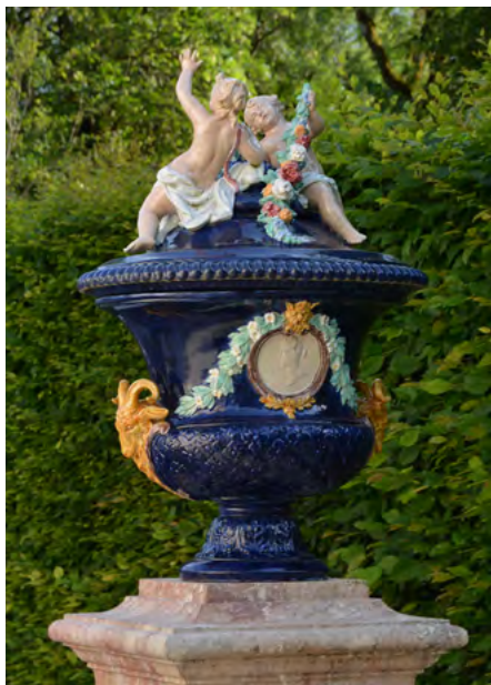
Wazon – majolika z manufaktury norymberskiej