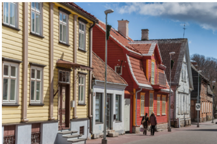
▲ Drewniane domy w centrum Parnawy

W czasie wojen inflanckich Parnawa stała się jednym z miast należących do Rzeczypospolitej , następnie przeszła w ręce Szwedów. W latach 1699–1710 przeniesiono do niej główną siedzibę Uniwersytetu Dorpackiego. Profesorowie i studenci rezydowali tu co prawda niedługo, wystarczająco jednak, by rozbudzić w mieszkańcach świadomość narodową. W 1710 r. Parnawa znalazła się w granicach Rosji. Rosjanie traktowali ją jako nadmorski kurort wypoczynkowy. W wieku XIX miasto stało się głównym ośrodkiem narodotwórczym zachodniej Estonii, przy okazji umacniając swoją pozycję jako ośrodek wypoczynkowy, tym razem również dla Estończyków.