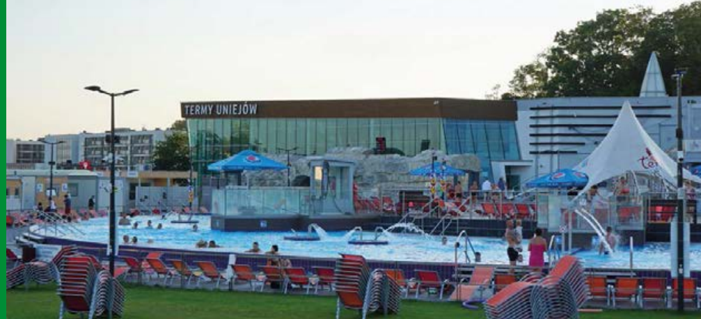
▲ Termy Uniejów

Ze względu na turystyczny charakter miejscowości w Uniejowie nie brakuje lokali gastronomicznych. Restauracje i kawiarnie znajdują się w kompleksie termalnym oraz w jego sąsiedztwie, a także na zamku. Dobrą opinią cieszy się karczma na terenie Zagrody Młynarskiej (ul. Abp. Świnki 1). Sporo lokali mieści się również na drugim brzegu Warty, m.in. Restauracja Zorbas Uniejów (ul. bł. Bogumiła 9) – dania tradycyjnej kuchni polskiej oraz pizza z pieca, Pierogarnia pod 30-ką (ul. bł. Bogumiła 30) czy Pizzeria Pico Bello (ul. Sienkiewicza 18a).