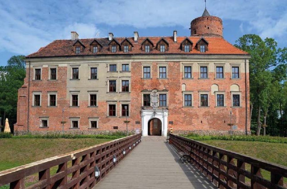
▲ Zamek w Uniejowie

Najłatwiejsza z nich jest przystosowana dla dzieci od 3. roku życia. Dużą atrakcją jest możliwość liczącego aż 220 m zjazdu tyrolką na drugi brzeg Warty.