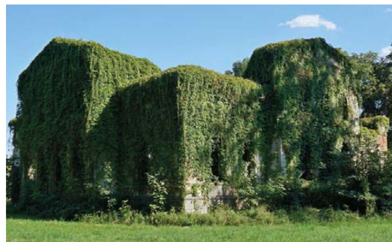
▲ Dwór Dzierzbickich w Biernacicach

Uniejów jest miejscowością o długiej historii, sięgającej XI w. Świadkiem czasów średniowiecznych jest kolegiata Wniebowzięcia NMP i św. Floriana . Ceglana świątynia przy północno-zachodnim narożniku Starego Rynku została wzniesiona w XIV w., a następnie przebudowana w XVI w. Na uwagę zasługuje sąsiadująca z kościołem 25-metrowa, wolnostojąca wieża zegarowa, będąca jednocześnie dzwonnica. Wzniesiono ją znacznie później, bo na przełomie XIX i XX w., w stylu neobarokowym.