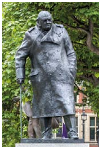
▲ Pomnik Churchilla na Parliament Square

a sam adres jest niewątpliwie najbardziej znany w brytyjskiej stolicy. „Numer dziesięć”, jak nazywają go londryńczycy, jest siedzibą polityków piastujących dziś tożsame z premierem rządu stanowisko pierwszego lorda skarbu. Za czarnymi drzwiami domu rozegrało się wiele historycznych chwil – budynek był m.in. głównym centrum brytyjskiego dowodzenia podczas dwóch wojen światowych. To tu odbyło się wiele decydujących spotkań głów państw i tu od 1856 r. co tydzień zbierają się członkowie gabinetu Wielkiej Brytanii.