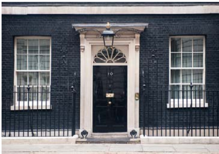
▲ 10 Downing Street

i dojazd metrem, linie Circle, District, Jubilee, stacja Westminster; www.number10.gov.uk jest prawdopodobnie jedną z najlepiej rozpoznawalnych na świecie,