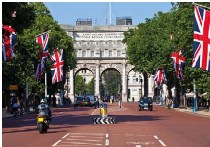
▲ The Mall i Admiralty Arch

Brytyjczycy lubią myśleć o The Mall jako o najładniejszej asfaltowej drodze na świecie. Ulica wiedzie aż do stojącego przed pałacem Buckingham pomnika królowej Wiktorii. Po południowej stronie deptaku leży park św. Jakuba, po północnej zaś Green Park. W XVII w. wytyczona została tu droga ustanowiona przez króla Karola II, która szybko stała się najmodniejszą promenadą w Londynie. Paradna trasa wjazdowa