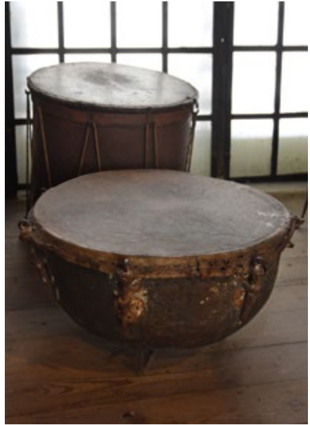
Tarabany z XVII w. (wyposażenie ówczesnego wojska)