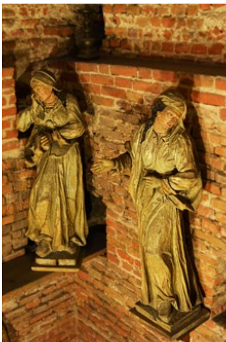
Ekspozycja w wieży, przy schodach