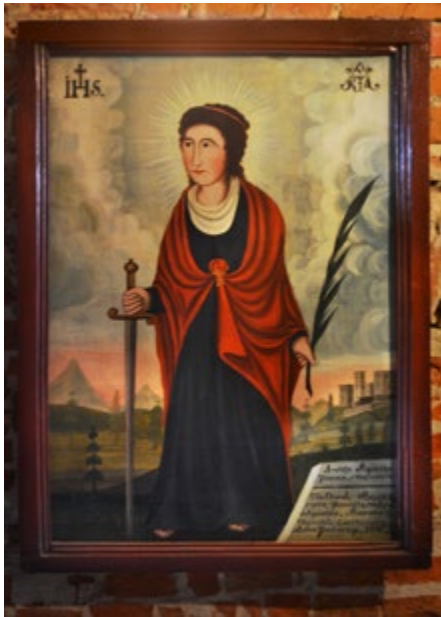
Święta Agnieszka (z kościoła św. Anny w Zaklikowie) Zwiastowanie, XVII w.

Na platformę widokową prowadzą dębowe schody. Po drodze na tle ceglanych murów umieszczono ekspozycję dzieł sztuki.