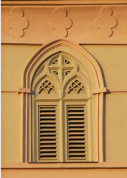
Ostrołukowe okno pseudomaswerkowe (elewacja południowa) Neogotycki portal (elewacja południowa)

Wieża w podstawie jest kwadratowa, powyżej węższa i ośmioboczna, a w ostatniej kondygnacji znów na planie kwadratu.