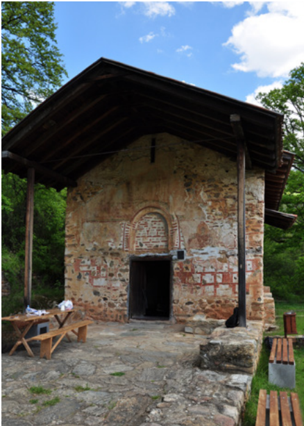
Fasada (elewacja zachodnia)