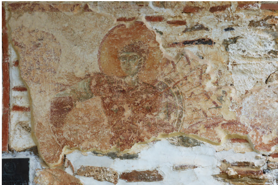
Polichromie na fasadzie (elewacja zachodnia)

Na zewnątrz, od zachodu i południa, zachowały się niewielkie fragmenty fresków. Pochodzą z czasów budowy świątyni.