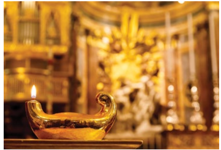
▲ W konkatedrze św. Jana w Valletcie

zakonników. Zakon rycerzy św. Jana był bowiem podzielony na tak zwane „języki” ( langues ), w zależności od pochodzenia danej grupy braci. Ostatnim pomieszczeniem po lewej stronie jest zakrystia, która została zbudowana w 1598 r., a z biegiem czasu dodano do niej nowe elementy. W 1758 r., za rządów Wielkiego Mistrza Manuela Pinto, została odnowiona.