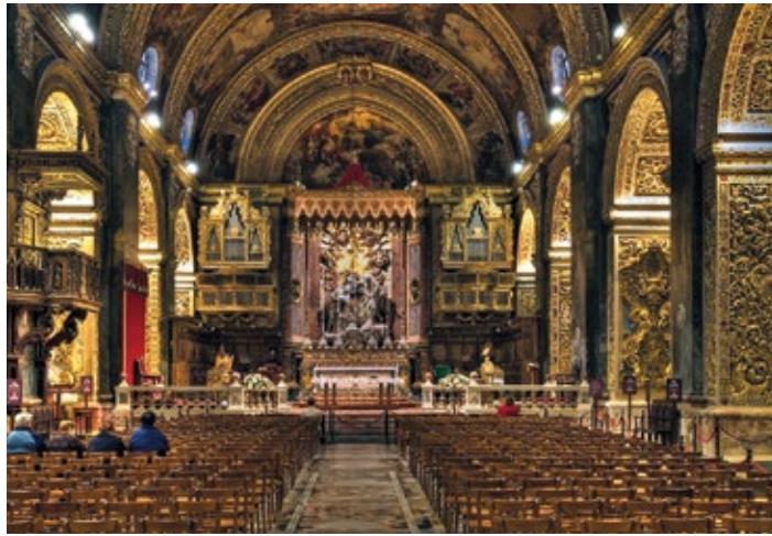
▲ Wnętrze konkatedry św. Jana w Valletcie

o takiej konstrukcji można zobaczyć w każdej maltańskiej miejscowości. Pomimo niezbyt efektownego wyglądu zewnętrznego, wnętrze świątyni zachwyca barokowymi zdobieniami i złoconiami. Duże wrażenie na zwiedzających wywiera marmurowa podłoga pokryta kolorowymi płytami nagrobnymi. Barokowy wystrój wnętrza kościoła powstał w XVII w. Zakon sfinansował jego przebudowę, a wielu rycerzy ofiarowało cenne dary.