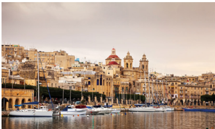
▲ Jachty zacumowane w porcie w Vittoriosie

przez bombardowania z czasów II wojny światowej. Tam też znajduje się pierwsza maltańska świątynia zakonu joannitów – kościół św. Wawrzyńca. Był on głównym kościołem joannitów do czasu wybudowania konkatedry św. Jana w nowo powstałej stolicy – Valletcie. W Birgu mieściła się siedziba inkwizytora, która obecnie jest udostępniona zwiedzającym.