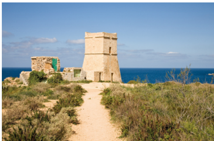
▲ Jedna z wież strażniczych na wybrzeżu

Chcąc dotrzeć do wieży Għajn Hadid i fortu Campbell, należy przemieszczać się z Mellieħy na południe drogą nr 1, a na rondzie tuż za miastem wybrać drogę prowadzącą na wschód do Selmun. W Selmun znajduje się rozwidlenie dróg – trasa w lewo prowadzi do wieży Għajn Hadid, natomiast droga na prawo – do fortu Campbell.